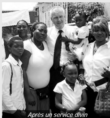
Après un service divin