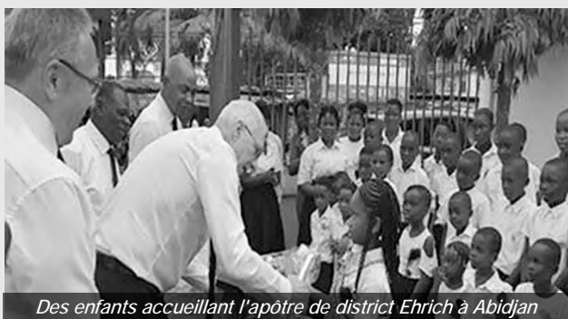
Des enfants accueillant l'apôtre de district Ehrich à Abidjan

région. À cette occasion, de nombreux actes ministériels au niveau du district ont également été accomplis. Au fil des ans, l'apôtre de district Ehrich a soutenu de nombreux projets, notamment la construction d'édifices religieux et d'écoles, l'installation de puits d'eau, l'octroi de bourses d'études pour les jeunes, l'organisation de séminaires et de programmes de formation, ainsi que des initiatives d'aide humanitaire. Ces efforts ont grandement contribué au renforcement et au développement des communautés locales. À l'approche de son départ à la retraite, l'apôtre de district Ehrich continue de mettre un accent particulier sur une prédication profonde, l'unité, l'humilité et la confiance dans le retour prochain de notre Seigneur Jésus-Christ.