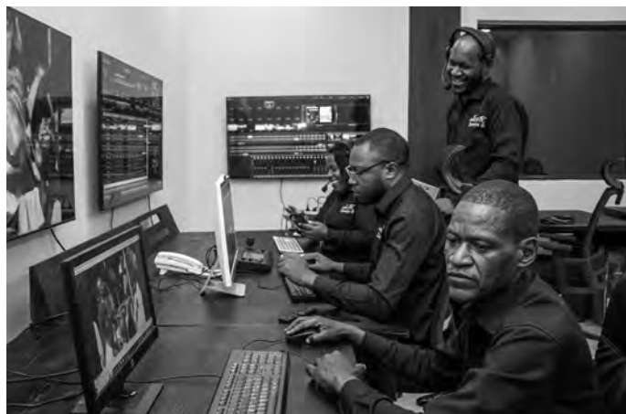
L'équipe média de NAC 28 TV au travail