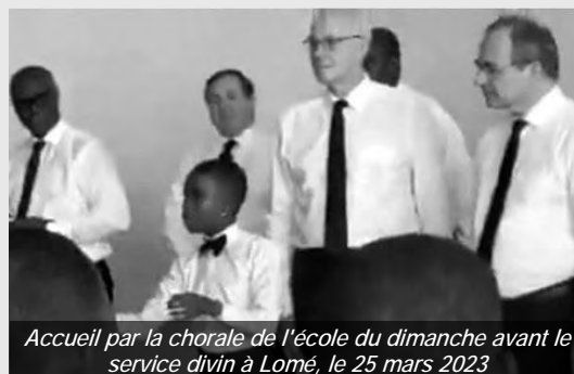
Accueil par la chorale de l'école du dimanche avant le service divin à Lomé, le 25 mars 2023