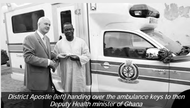
District Apostle (left) handing over the ambulance keys to then Deputy Health minister of Ghana