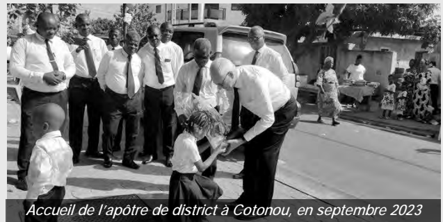
Accueil de l'apôtre de district à Cotonou, en septembre 2023