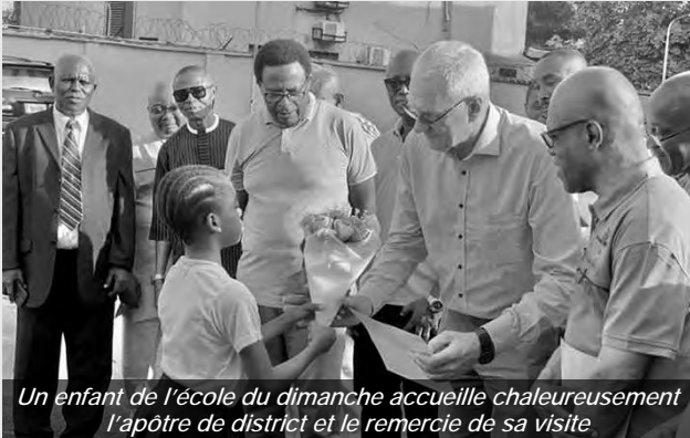
Un enfant de l'école du dimanche accueille chaleureusement l'apôtre de district et le remercie de sa visite.