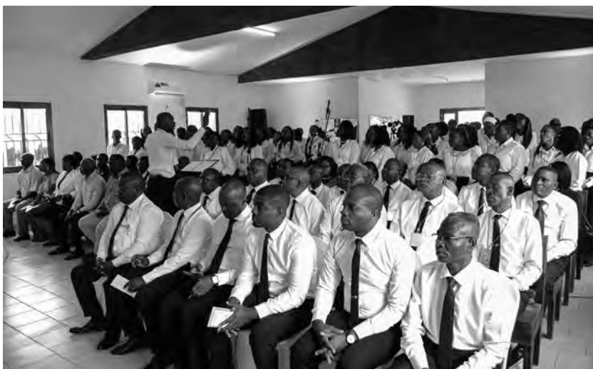
La communauté à Libreville (Gabon) le 5 octobre 2025

« tons les dons qu'il nous a faits. » Tout comme Dieu est fidèle, « nous aussi, nous voulons être fidèles et faire le bien, même quand les choses vont mal ».