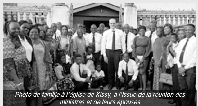
Photo de famille à l'église de Kissy, à l'issue de la réunion des ministres et de leurs épouses