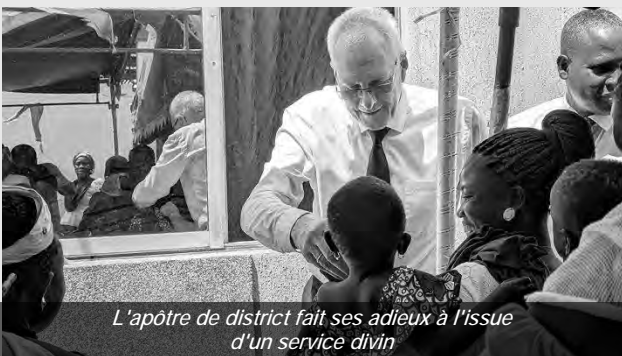
L'apôtre de district fait ses adieux à l'issue d'un service divin