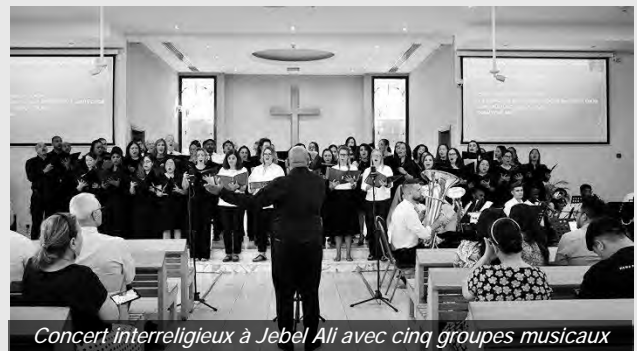
Concert interreligieux à Jebel Ali avec cinq groupes musicaux