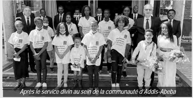
Après le service divin au sein de la communauté d'Addis-Abeba