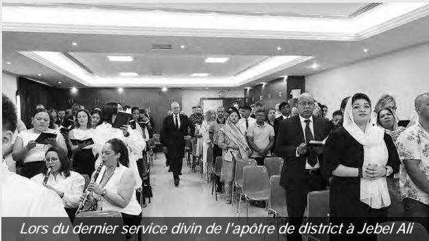
Lors du dernier service divin de l'apôtre de district à Jebel Ali