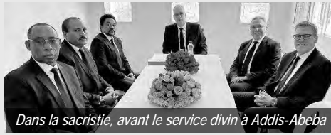
Dans la sacristie, avant le service divin à Addis-Abeba

Djibouti. Un mot de remerciement particulier est adressé à notre apôtre de district de la part de l'école Selam Hiwot. Grâce au soutien financier de l'organisation Human Aktiv, les frais de fonctionnement courants — tels que les cahiers d'exercices, les carnets et les stylos — ont pu être pris en charge pour notre école située à Sebeta, en Éthiopie. Au total, environ 530 élèves fréquentent notre établissement. De la première à la sixième année, les enfants reçoivent leur enseignement dans les langues locales, l'amharique et l'oromo. Les frères et sœurs d'Éthiopie et de Djibouti remercient notre apôtre de district pour tout son soutien et pour son service au cours de ces dernières années, et lui souhaitent une retraite riche en bénédictions