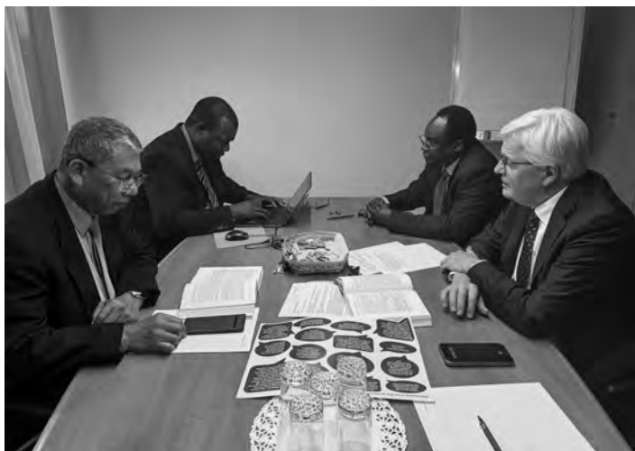
Lors de l'assemblée des apôtres de district en novembre 2025, les apôtres de district et leurs adjoints ont échangé en petits groupes sur le thème de la pastorale

culières », complètent les Directives à l'usage des ministres au paragraphe 7.10.