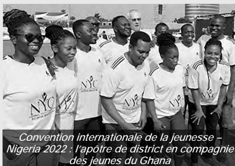
Convention internationale de la jeunesse - Nigeria 2022 : l'apôtre de district en compagnie des jeunes du Ghana