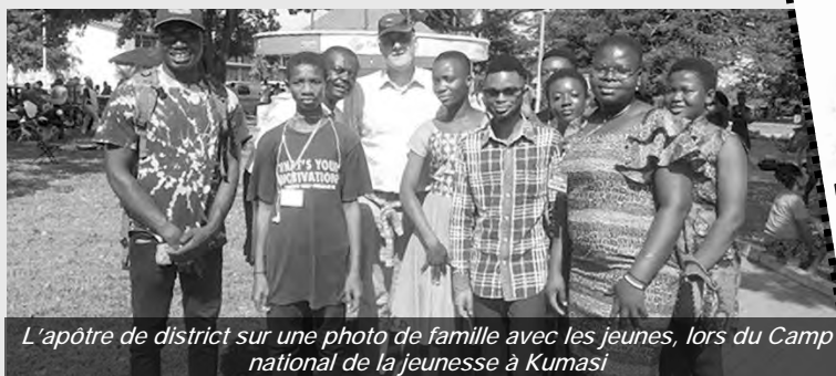
L'apôtre de district sur une photo de famille avec les jeunes, lors du Camp national de la jeunesse à Kumasi