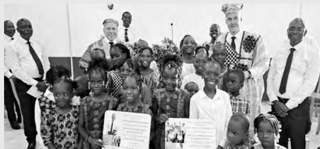
Un axe majeur de l'œuvre a été le soutien aux enfants et aux jeunes