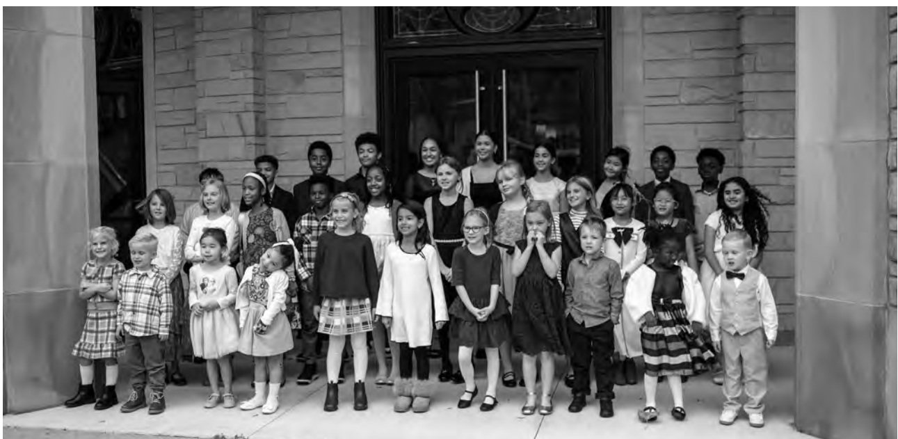
Les enfants accueillent l'apôtre-patriarche à son arrivée par un chant

Jésus a exigé une façon de penser totalement nouvelle : les hommes devaient changer leur disposition de cœur, tout devait devenir nouveau