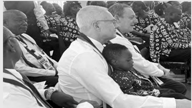
L'apôtre de district avec un enfant lors de sa visite en janvier 2026