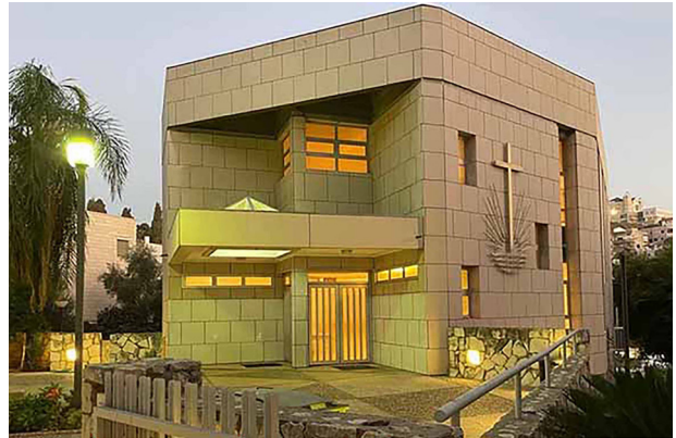
Das Kirchengebäude in Nazareth

Weitere Details zu diesem Artikel erhalten Sie, wenn Sie unserer Website besuchen.