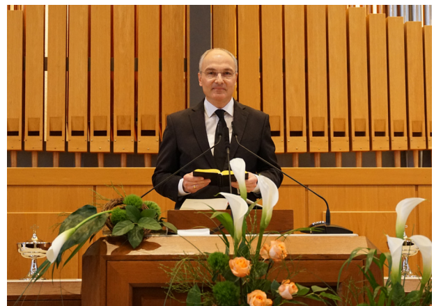
Der Stammapostelhelfer am Altar in der Kirche in Freudensstadt

Zu Beginn seiner Predigt ging der zukünftige Stammapostel auf das Thema „Demut“ ein, das in unseren Zeiten sehr wichtig sei: „Hätten die Menschen mehr Demut, gäbe es ganz viele Probleme nicht. Jesus Christus sagte: ‚Ich bin sanftmütig und von Herzen demütig.‘“ Anschließend erläuterte der Stammapostelhelfer das Jahresmotto 2026 unserer Kirche: „Fürchte dich nicht, glaube nur!“ (Markus 5, Vers 36b). Er spannte einen Bogen von der Berufung Mose am brennenden Dornbusch bis hin zum Alltag der Gläubigen heute. Dabei machte er deutlich, dass Gott kein ferner Gott sei, sondern ein Gott der Nähe, dem sowohl das Leid als auch das Wohlergehen der Menschen nicht gleichgültig sei. Die Zusage Gottes „Ich will mit dir sein“ gelte nicht nur für außergewöhnliche und fordernde Lebenssituationen, sondern ebenso im ganz normalen Alltag.