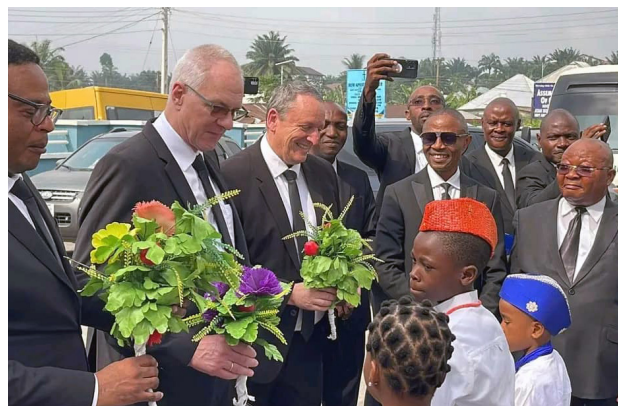
Der Bezirksapostel und Apostel Rheinberger wurden freudig begrüßt.

Die vollständige Version des Artikels steht auf unserer Website zur Verfügung.