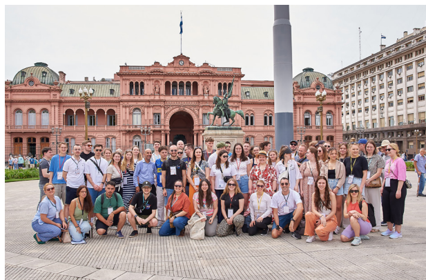
Rund 50 süddeutsche Jugendliche verbrachten eine tolle Zeit in Buenos Aires.

Mehr Hintergrundinformationen finden Sie, indem Sie auf unsere Website gehen.