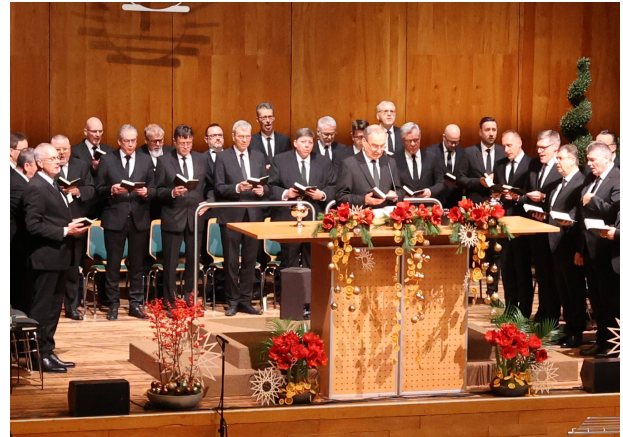
Der Stammapostel am Altar in der Stadthalle in Eberbach

Ganz sichtbar im Mittelpunkt des Gottesdienstes standen die Kinder des Kirchenbezirks. Sie waren in den vorderen Sitzreihen platziert und sangen mit dem gemischten Chor mehrere Beiträge. Der Stammapostel schilderte ihnen zu Beginn seiner Predigt die Geschichte, die dem Bibelwort zugrunde lag. Auch für die Erwachsenen beantwortete der Stammapostel die Frage, welche Lehren sich aus der Erzählung ziehen lassen. Die Geschichte um Rebekka sei eine schöne Beschreibung des Heilswirkens des dreieinigen Gottes und habe für die Gegenwart Bedeutung. So