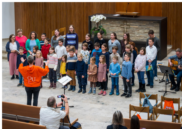
Beim Jubiläumskonzert in Reutlingen waren die Kinder wieder mit Eifer dabei.

Die vollständige Version des Artikels steht auf unserer Website zur Verfügung.