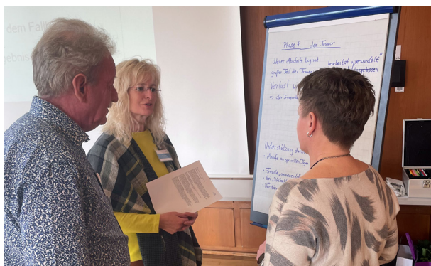
Zwei Tage lang haben sich Seelsorger unserer Kirche weitergebildet.

Eine vertiefende Version dieses Artikels erhalten Sie auf unserer Website.