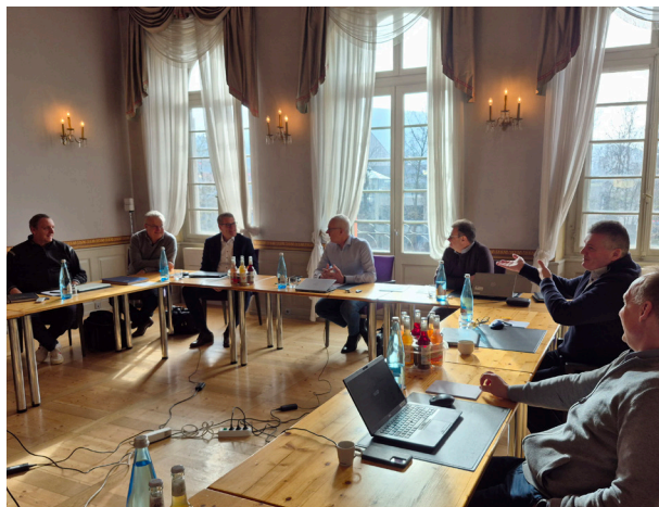
Die süddeutschen Apostel haben sich in Ettlingen ausgetauscht.

So wurde beispielsweise über das anstehende Bezirksämterwochenende gesprochen, eine regelmäßig stattfindende Zusammenkunft mit den leitenden Amtsträgern der einzelnen Kirchenbezirke. Es wurde auch über das Projekt „Gemeinde der Zukunft“ und ein geplantes Liturgiebuch zur Unterstützung der ehrenamtlichen Amtsträger in den Gemeinden diskutiert.