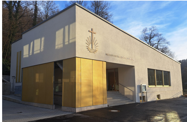
Die Kirche in Oberndorf wurde von der Architektenkammer ausgezeichnet.

Gehen Sie auf unsere Website, um die weiterführende Version dieses Artikels zu lesen.