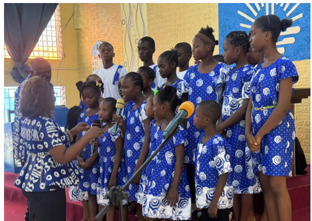
Ein Kinderchor erfreute die Zuhörer mit seinem Vortrag.

Gehen Sie auf unsere Website, um die weiterführende Version dieses Artikels zu lesen.