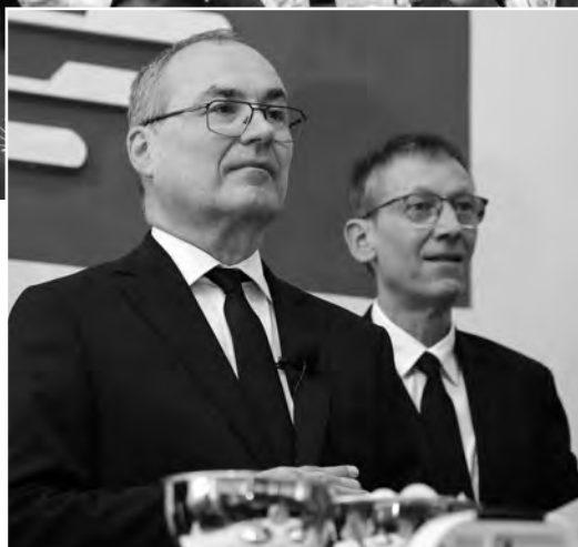
Dimanche 27 juillet 2025, l'apôtre-patriarche Jean-Luc Schneider a célébré un service divin à Mbuji Mayi, en République Démocratique du Congo Sud-Est