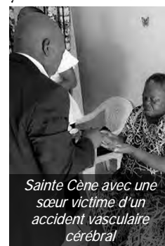
Sainte Cène avec une sœur victime d'un accident vasculaire cérébral

Des personnes vivant avec un handicap, ayant subi un AVC, et de nombreuses autres personnes malades de la communauté de Kribi-Ville et du district en général, ont trouvé réconfort et force dans leur foi, assurées de ne jamais être seules ni abandonnées. Grâce aux visites des ministres, certaines personnes affligées ont pu constater par elles-mêmes cette vérité : « Dieu veille sur tous ceux qui lui font confiance et prend soin d'eux, même dans les moments difficiles. »