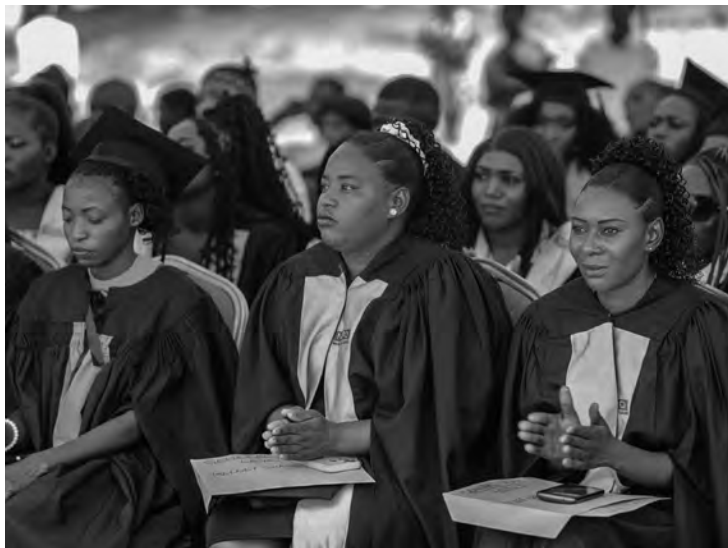
Les diplômés du centre de formation professionnelle de Chabota