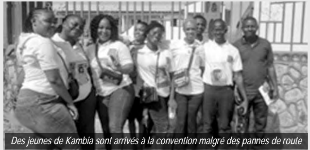
Des jeunes de Kambia sont arrivés à la convention malgré des pannes de route