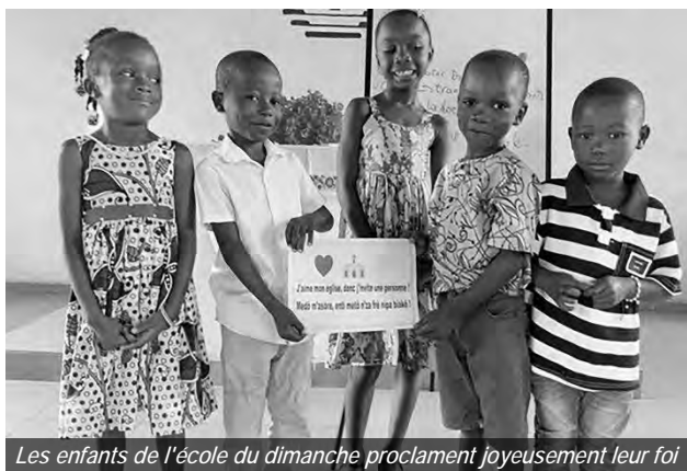
Les enfants de l'école du dimanche proclament joyeusement leur foi