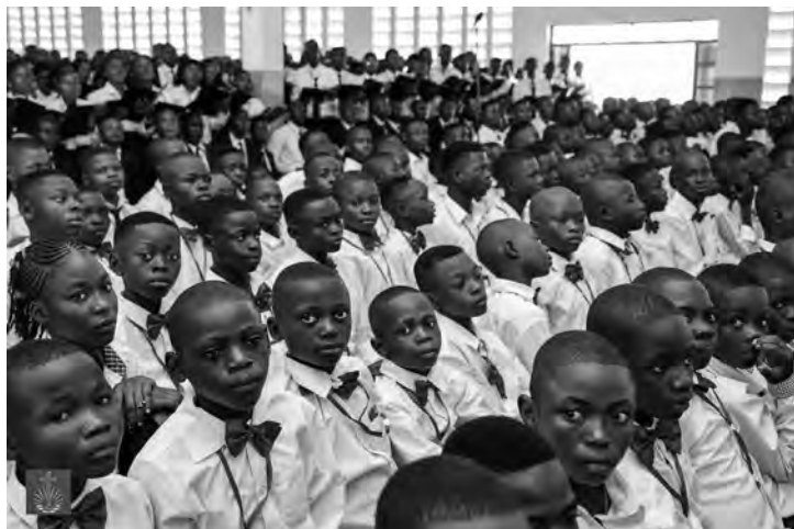
Près de 15 000 frères et sœurs ont participé au service divin