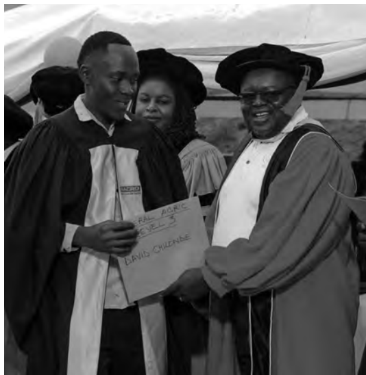
Remise de diplôme aux diplômés et photo annuelle