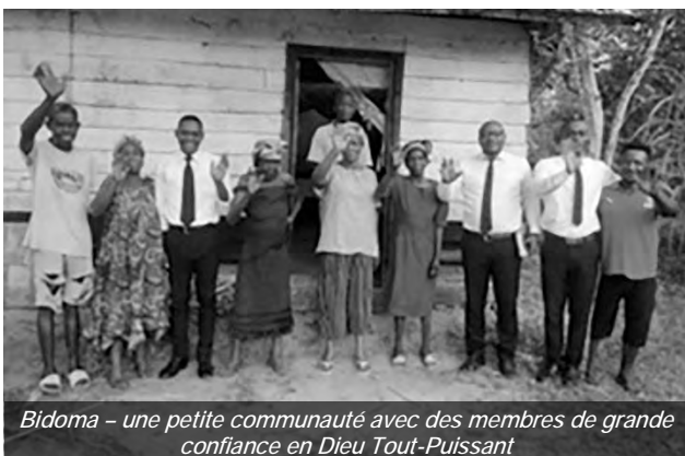
Bidoma - une petite communauté avec des membres de grande confiance en Dieu Tout-Puissant

Surtout dans les zones rurales, de nombreuses petites communautés souffrent du décès de leurs membres, de l'exode des villageois, notamment des jeunes, qui cherchent du travail en ville, et, hélas, parfois de la migration de certains vers d'autres groupes religieux qui promettent guérison et prospérité. Dans ce contexte, un accompagnement pastoral régulier, et en particulier les visites de l'apôtre et des serviteurs sacerdotaux, fortifient les fidèles afin qu'ils demeurent fermes dans leur foi et vivants dans leur attente du retour de l'Époux de notre âme, Jésus-Christ.