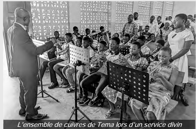
L'ensemble de cuivres de Tema lors d'un service divin

En janvier 2024, le recteur de la communauté de Tema (Accra) a eu l'inspiration de créer un ensemble de cuivres. Des questions de pérennité se sont posées, mais Dieu a touché les cœurs et un soutien généreux a suivi. Ce qui n'était au départ qu'une idée fragile a pris forme lorsqu'un professeur de musique s'est joint au projet. Deux ans plus tard, l'ensemble de cuivres de Tema joue mieux que jamais. Composé de membres de l'école du dimanche, du catéchisme et des jeunes, il est devenu une source de joie et d'unité à Accra. Des services divins de mariage, en passant par les week-ends pour les jeunes et des concerts, sa musique est désormais très recherchée et chaleureusement accueillie. Là où régnait le doute, la grâce de Dieu résonne maintenant dans chaque note. La peur s'est transformée en foi – « Ne crains pas, crois seulement ! » – et Dieu a fait d'un modeste début une symphonie de louanges.