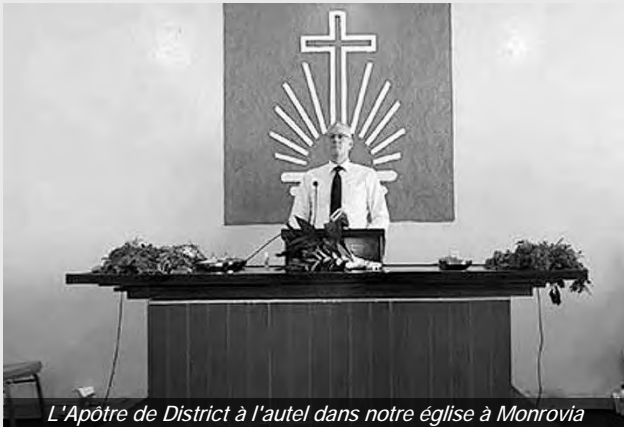
L'Apôtre de District à l'autel dans notre église à Monrovia