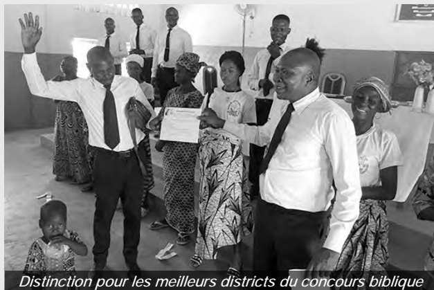
Distinction pour les meilleurs districts du concours biblique

Le samedi 7 février, un concours biblique a réuni les huit districts du nord du Bénin, avec des participants des groupes Jeunes, Femmes et Ministres. La visite s'est conclue le dimanche 8 février par un service divin auquel ont assisté plus de 700 croyants. S'appuyant sur Marc 5 : 28, l'apôtre dirigeant a encouragé l'assemblée à s'approcher du Christ avec confiance. Les fidèles sont repartis fortifiés dans leur foi, assurés que le Christ nous appelle à croire et à rechercher sa proximité.