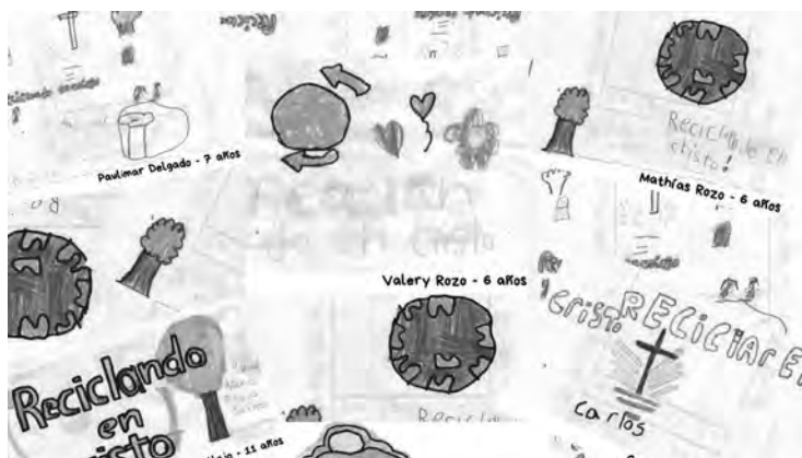
Les logos que les enfants de l'école du dimanche ont eux-mêmes créés sur le thème du projet « Reciclando en Cristo »