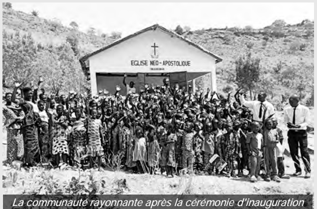
La communauté rayonnante après la cérémonie d'inauguration

Fortifiée par sa foi, la communauté a persévéré et, le 7 février 2026, l'apôtre Kloutsè a inauguré le nouvel abri en présence des autorités locales – un témoignage joyeux d'une foi qui a triomphé de tous les obstacles.