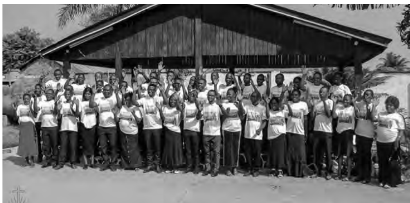
Remise des certificats après la réussite de la formation (à gauche) Photo de groupe des participants (à droite)