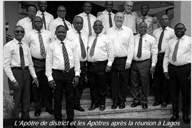
L'Apôtre de district et les Apôtres après la réunion à Lagos