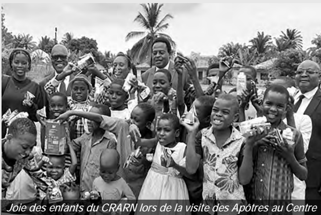
Joie des enfants du CRARN lors de la visite des Apôtres au Centre