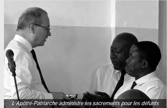
L'Apôtre-Patriarche administre les sacrements pour les défunts