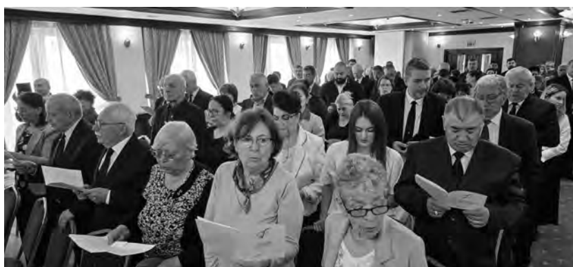
La communauté le 11 mai 2025 à Sighisoara, en Roumanie

est-elle si injuste ? » Mais la grâce de Dieu est tout aussi inexplicable : « Pourquoi Dieu veut-il précisément me faire tant de bien, à moi ? Je ne peux pas le mériter. »