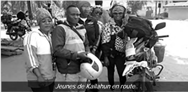
Jeunes de Kailahun en route