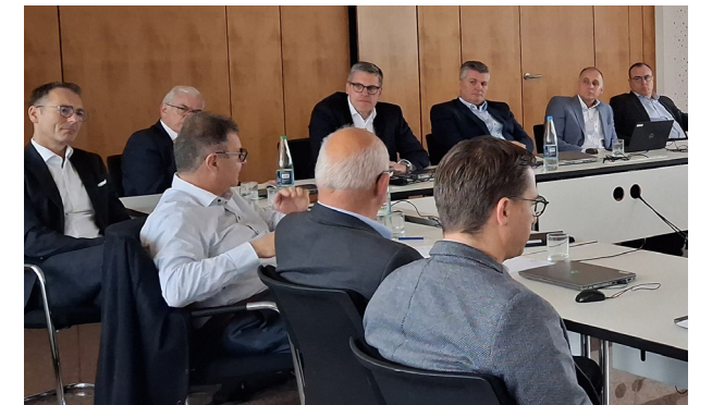
Die Apostel und Bischöfe tauschen sich regelmäßig aus.

Mehr Hintergrundinformationen finden Sie auf unserer Website.