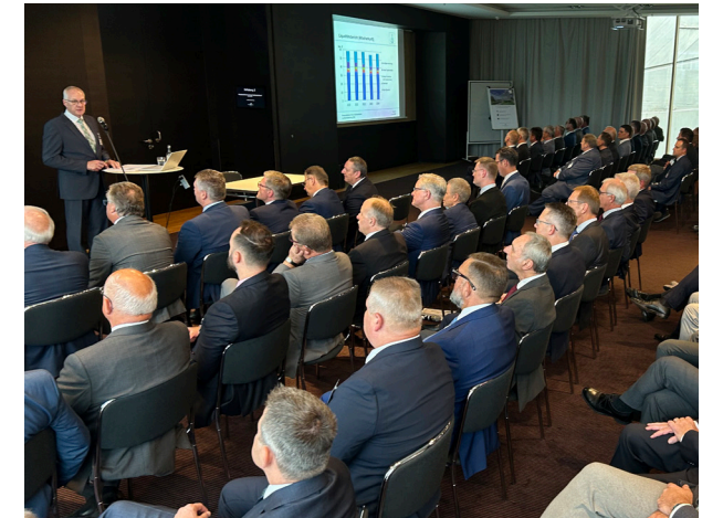
Die Landesversammlung tagt mindestens einmal jährlich.

Die ausführliche Version dieses Artikels finden Sie auf unserer Website.