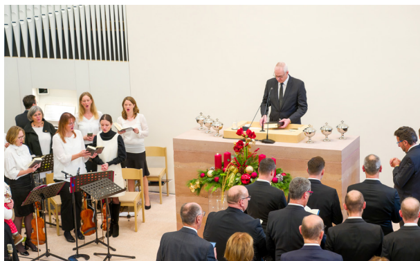
Der erste Gottesdienst im neuen Kirchengebäude Nürnberg-Mitte

Weitere Details zu diesem Artikel erhalten Sie auf unserer Website.