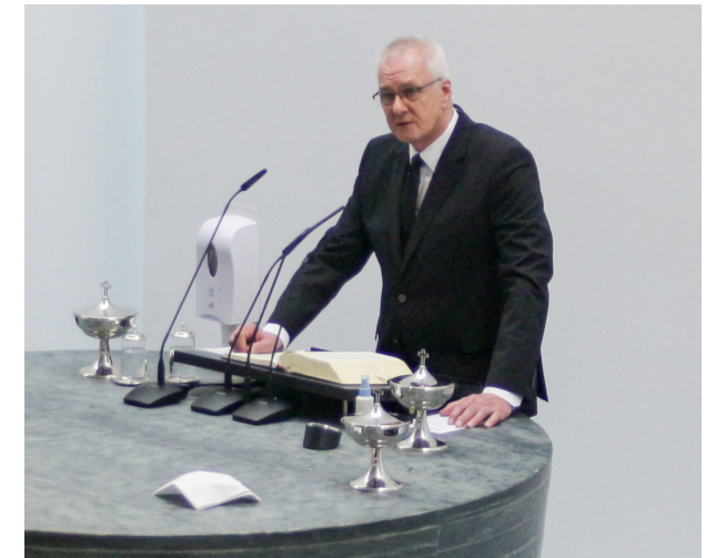
Unser Bezirksapostel am Altar in der Kirche in Freiburg-Ost