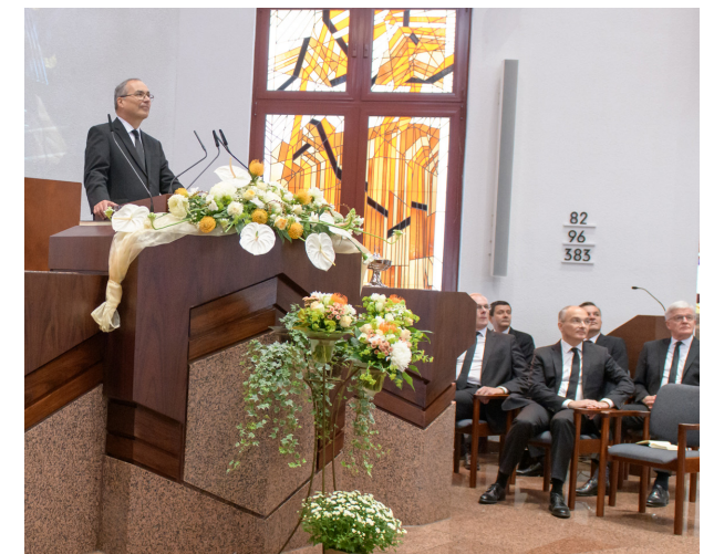
Der Stammapostel am Altar in der Kirche in Karlsruhe-Mitte

Zu Beginn richtete der Stammapostel eine persönliche Botschaft an die Gottesdienstteilnehmer: Er dankte allen Amtsträgern für ihren Einsatz, ihre Gebete und ihre Unterstützung. Dem Gottesdienst lag das Bibelwort aus Matthäus 25,21 zugrunde: „Da sprach sein Herr zu ihm: Recht so, du guter und treuer Knecht, du bist über wenigem treu gewesen, ich will dich über viel setzen; geh hinein zu deines Herrn Freude!“ Der Stammapostel stellte die Frage, was einen guten Knecht ausmache, und führte aus, dass