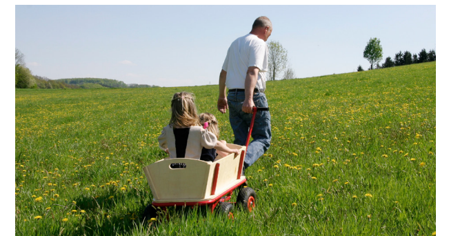
Die Familienrüstzeit bietet eine Auszeit vom gewohnten Alltag.

Eine vertiefende Version dieses Artikels finden Sie auf der Website von human aktiv.