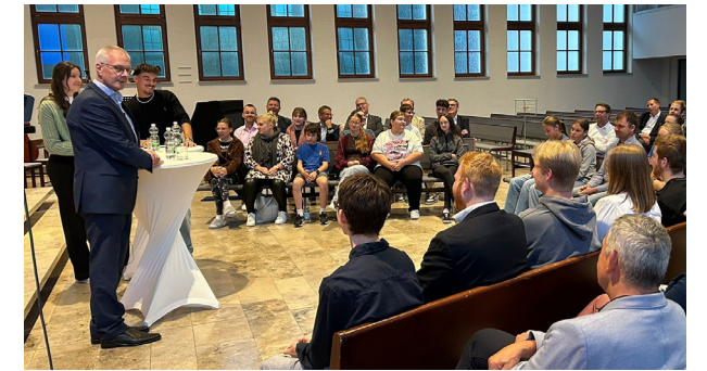
Der Bezirksapostel beantwortete gerne die vielen Fragen der Jugendlichen.

Die ausführliche Version dieses Artikels finden Sie auf unserer Website.