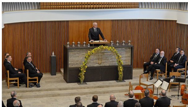
Der Bezirksapostel am Altar in Reutlingen

Mehr Hintergrundinformationen finden Sie auf unserer Website.