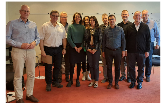
Die Akademieleitung diskutierte über Weiterentwicklung und Angebote.

Auf unserer Website finden Sie die weiterführende Version des Artikels.