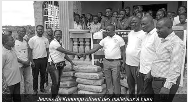
Jeunes de Konongo offrent des matériaux à Ejura