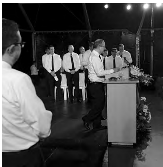
L'apôtre-patriarche a célébré un service divin à Cúcuta (Colombie) le 15 février