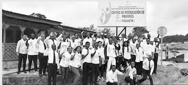
Les jeunes devant le Centre de rééducation pour mineurs de Teguete