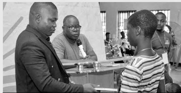
Un responsable de jeunesse présente un catéchisme à une jeune sœur