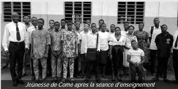
Jeunesse de Comé après la séance d'enseignement

Le passage biblique d'Isaïe 40:31 : « Ceux qui espèrent en l'Éternel renouvellent leur force ; ils prennent leur envol comme les aigles ; ils courent sans se fatiguer ; ils marchent sans se fatiguer », a été expliqué plus en détail par une lecture biblique des versets 25 à 30. L'apôtre a souligné que l'attente d'une rencontre avec Dieu n'est pas un acte passif, mais exige une foi active et persistante, qui se manifeste également, par exemple, par la participation à la chorale et au partage de l'Évangile. Il a encouragé les jeunes à participer activement aux préparatifs de la visite de l'apôtre-patriarche.