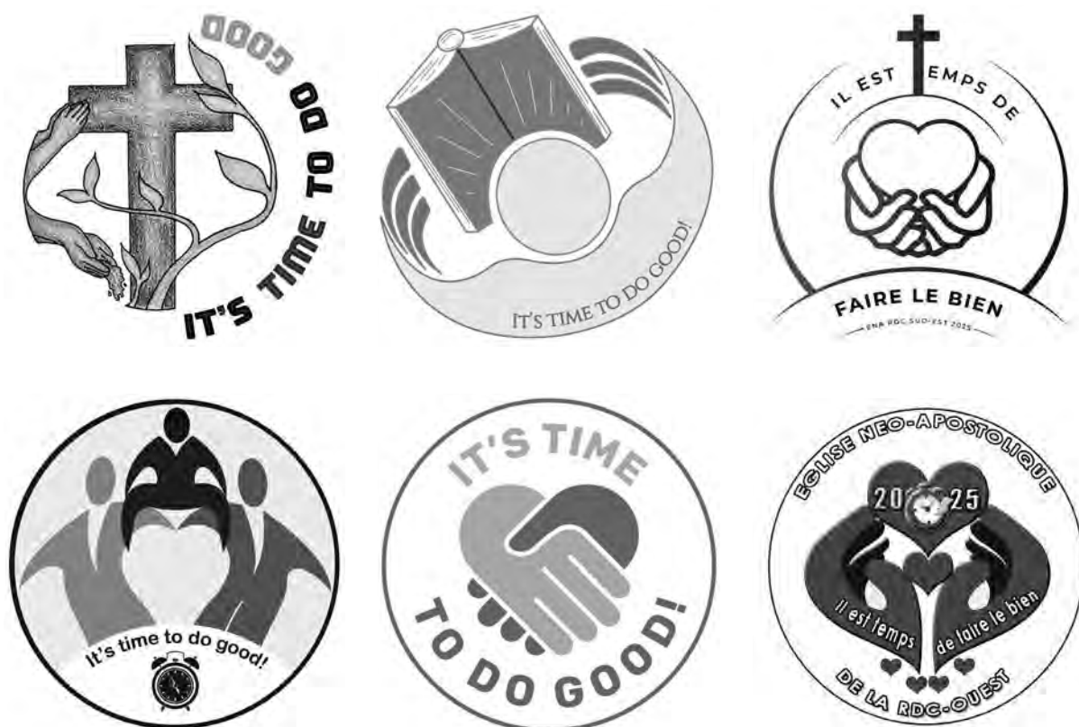
Les logos pour la devise de l'année 2025 créés par les différentes Églises territoriales

réponse à l'appel : « Aujourd'hui, si vous entendez sa voix, n'endurcissez pas vos cœurs ». Une horloge indique le caractère urgent. Et les deux mains – qui forment ensemble aussi un cœur – « sont prêtes à porter le poids d'autrui et à s'unir aussi dans la prière ».