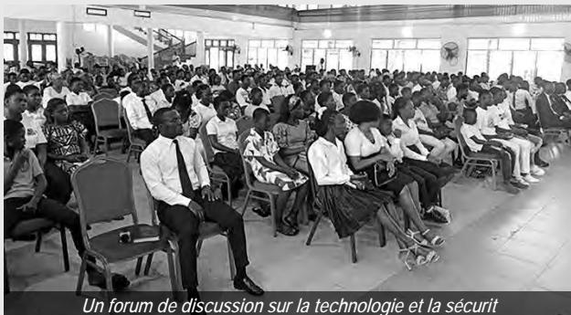
Un forum de discussion sur la technologie et la sécurité

ment a été marqué par la communion fraternelle et le service divin. Un geste important a été le don de matériaux pour la construction de la chapelle de la communauté d'Ejura. Pour plus de rapports du Ghana, consultez le site www.nac-ghana.org