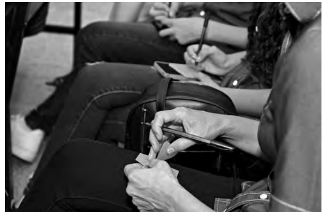
Lors de la soirée de jeunesse avec l'apôtre-patriarche le 26 septembre 2024, c'est l'apôtre-patriarche Jean-Luc Schneider qui a questionné les jeunes