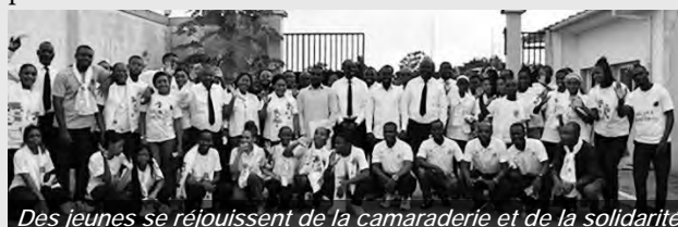
Des jeunes se réjouissent de la camaraderie et de la solidarité

À la fin de la visite, l'apôtre a célébré un service divin avec l'ensemble des personnes présentes. Les échanges avec les jeunes et le service divin ont porté sur l'histoire des deux larrons sur la croix (Luc 23, 32-43). Au cours du service divin, l'apôtre a une fois de plus souligné l'amour de Dieu pour chaque personne ; cependant, il est crucial de rendre cet amour par de bonnes actions et un bon comportement pour le bien de la société.