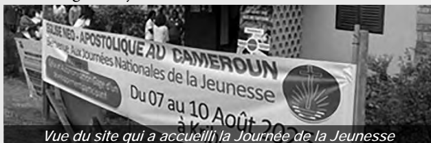
Vue du site qui a accueilli la Journée de la Jeunesse

L'apôtre Ebanga Edoa Félicien a invité les jeunes et leurs ministres des 12 districts ecclésiastiques de sa zone d'action à les fortifier par des activités spirituelles, socioculturelles et récréatives. Le passage biblique du service divin d'ouverture, prononcé par l'apôtre, relatant le comportement déterminé et pieux du jeune Joseph (Genèse 39:9), a servi de fil conducteur aux activités de la Convention. Lors du service divin de clôture, l'apôtre a attiré l'attention sur notre avenir glorieux avec un verset d'Apocalypse 19:7. L'annonce de la tenue de la prochaine Journée de la Jeunesse à Douala en 2028 a été accueillie avec une grande joie.