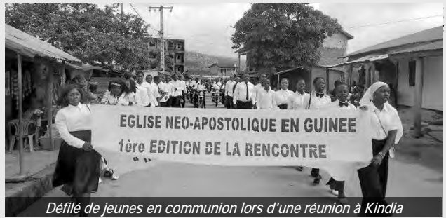
Défilé de jeunes en communion lors d'une réunion à Kindia