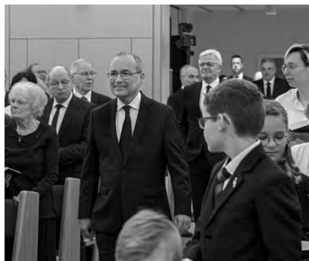
Service divin du 12 janvier 2025 à Spreewald (Allemagne)

« Celui qui observe le vent ne sèmera point. » La parole biblique fait ainsi appel à l'image de l'agriculteur. Celui-ci s'abstient de semer quand le vent souffle, afin que la semence ne soit pas emportée. « L'image des semailles dans la Bible est souvent utilisée pour évoquer notre façon de vivre. » Et : « Le vent symbolise tout ce qui rend les semailles difficiles. »