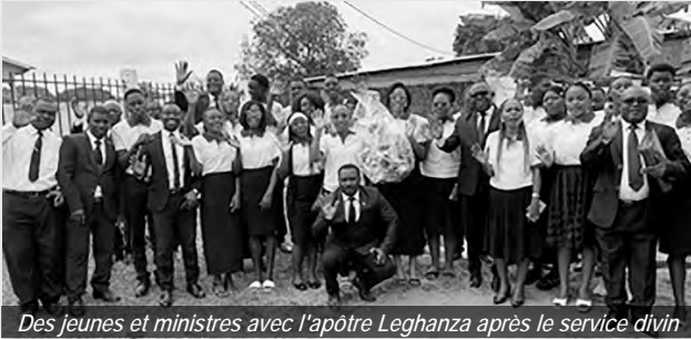
Des jeunes et ministres avec l'apôtre Leghanza après le service divin