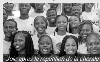
Joie après la répétition de la chorale

Sous la devise de cette année « Il est temps de faire le bien », les jeunes de Guinée, comme partout ailleurs en Afrique de l'Ouest, sont au cœur de la vie de l'Église. Ils participent à la chorale, à l'école du dimanche, au catéchisme, aux réunions de jeunes, aux répétitions de musique et aux sorties. Sur le