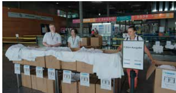
Im Eingangsbereich des großen Messegeländes wurden die bei vielen Teilnehmern lang herbeigesehnten SJT-T-Shirts ausgegeben.