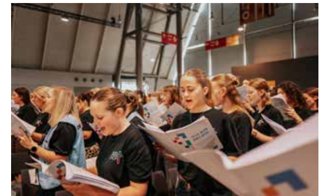
Der Chor und das Orchester begeisterten die Zuhörer.