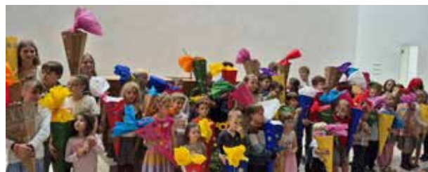
50 Schultüten haben die Kinder für andere Kinder gebastelt. Die Tüten wurden an die Stiftung „Wir helfen München – Bunte Münchner Kindl“ übergeben.

Zwei Priester führten kindgerecht in das Thema „Glauben und Zweifeln“ ein und stellten die Frage, wie man erkennen kann, ob etwas wahr oder falsch ist. Mit den Kindern stellten sie fest, dass es nicht so leicht ist, dies herauszufinden – vor allem wenn es Dinge sind, die man nicht sehen kann, sondern glauben muss. Hierfür gaben sie Beispiele: Wenn man einen Regenbogen anfasst, hat man dann nasse Hände? Konnte Jesus wirklich auf dem Wasser gehen? Beim Nachdenken können Zweifel kommen. Und manchmal braucht es Zeit, die Zweifel wieder loszuwerden – aber auch wenn wir zweifeln, ist es wichtig zu wissen, dass Gott uns lieb hat. Verlieren wir nicht den Mut, so die Botschaft.