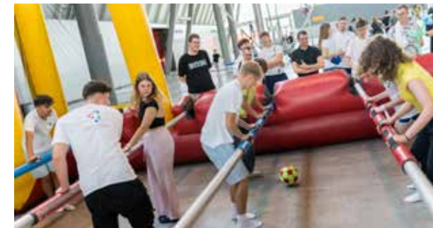
Viele Möglichkeiten zum Auspowern gab es in Halle 6. Besonders beliebt war der Menschenkicker, das Indoor-Cycling und die Fußball-Torwand.