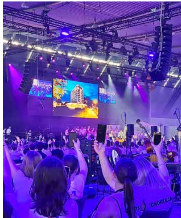
Ein zentrales Highlight der Eröffnungsfeier um 11 Uhr war das Schauspiel mit viel Musik zum Gleichnis vom verlorenen Sohn – eine moderne Inszenierung.