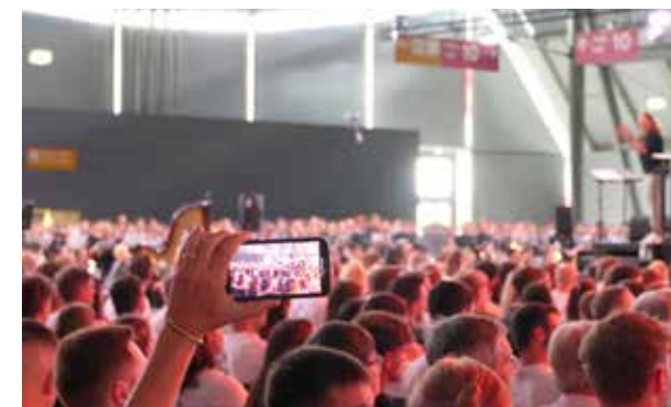
Erinnerungsfotos an ein bewegendes Wochenende