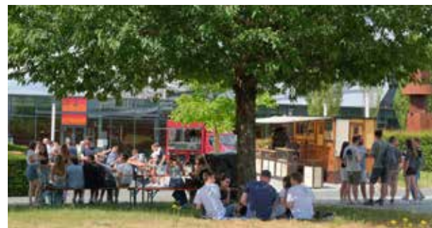
Im Messenpark gab es einige Foodtrucks, die das Essensangebot aus Halle 4 ergänzten. Viele entschieden sich für ein Picknick im Freien mit Freunden.