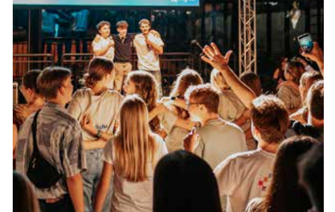
Nach der Abendveranstaltung gab es im Atrium Karaoke vom Feinsten bis weit nach Mitternacht. Dazu gab es alkoholfreie Cocktails.