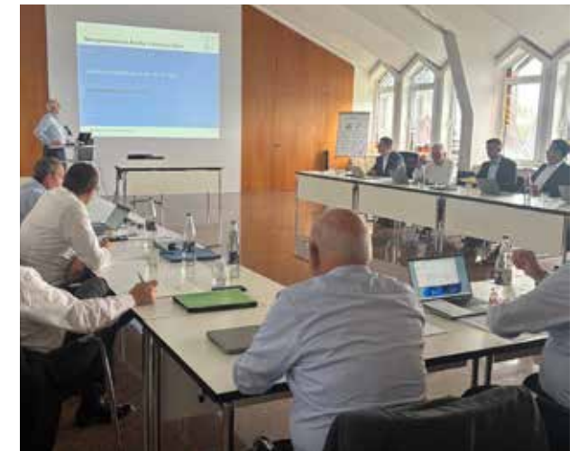
Unter dem Vorsitz unseres Bezirksapostels tagte der Landesvorstand im Verwaltungs- und Dienstleistungszentrum in Stuttgart-Degerloch.

Auf der Tagesordnung standen der Finanzbericht des Jahres 2024, die Erstellung des Jahresabschlusses, die Festlegung des Haushaltsplans für das Jahr 2026 sowie der Bericht der Baukommission.