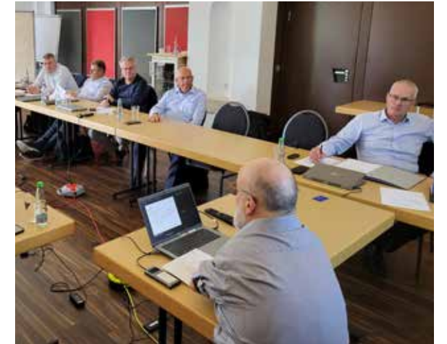
Die süddeutschen Apostel und Bischöfe tauschen sich regelmäßig zu verschiedenen Themen aus.

Zwei Mal pro Jahr tauschen sich die Apostel und Bischöfe mit dem Bezirksapostel in der ABV zu theologischen, administrativen und seelsorgerischen Themen für die mehr als 100.000 neuapostolischen Kirchenmitglieder in der Gebietskirche Süddeutschland aus.