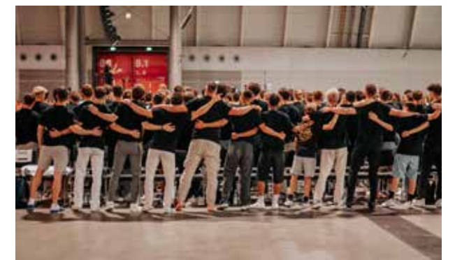
Die Sänger freuten sich darüber, das „ihr Chor“ nun eine feste Institution ist.