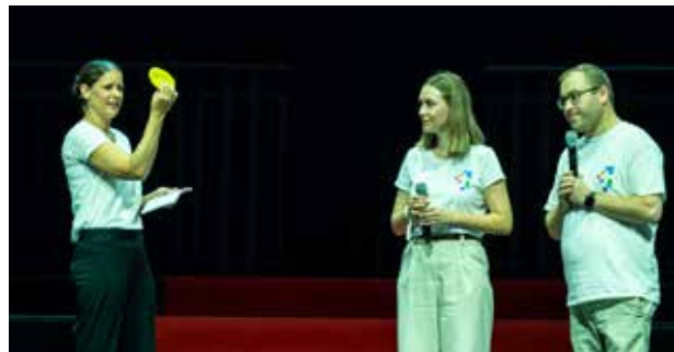
Bei der Eröffnungsfeier wurden zwei SJT-Botschafter befragt. Sie hatten mit zehn anderen Botschaftern im Vorfeld über den SJT informiert und Vorfreude geweckt.