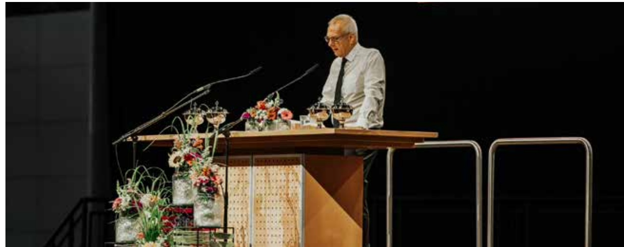
Der Bezirksapostel beim Festgottesdienst am Sonntag