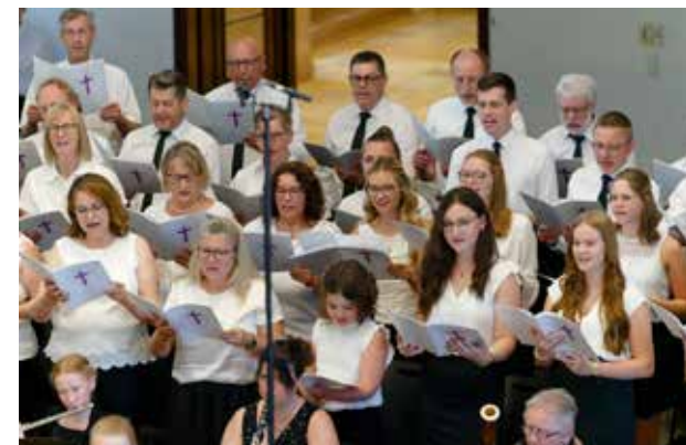
Die musikalischen Beiträge erfreuten die Zuhörer.

Dem Gottesdienst lag das Bibelwort aus Lukas 15, Verse 5 und 6 zugrunde: „Und wenn er's gefunden hat, so legt er sich's auf die Schultern voller Freude...“. Das Gleichnis vom verlorenen Schaf bildete den Schwerpunkt der Predigt. Der Stammapostel betonte, dass Jesus Christus jedem Einzelnen nachgeht – aus Liebe und in der Absicht, ihn zurück-