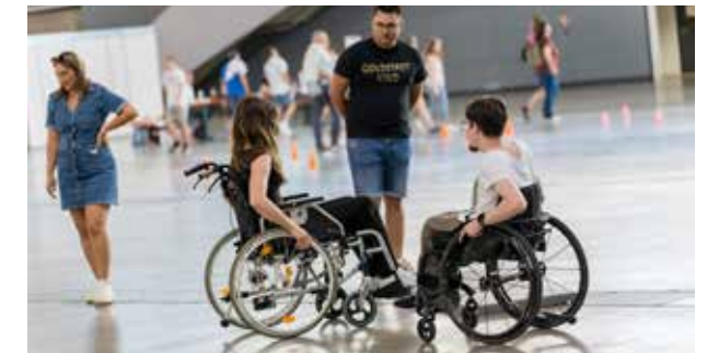
Wie sich Alltagssituationen für Menschen im Rollstuhl anfühlen, konnten die Teilnehmer beim Rollstuhlparcours erfahren.