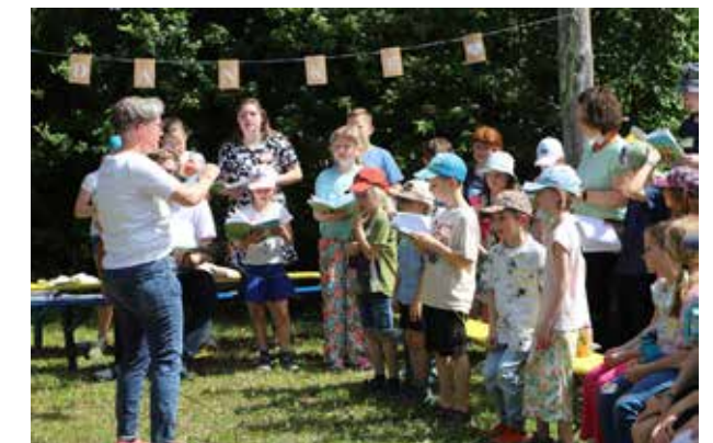
Rund 20 Kinder sangen mit großer Freude und begeisterten die Anwesenden.

Der Gottesdienst wurde von einem Priester und zwei Diakonen aus dem Bezirk Reutlingen gestaltet. Im Mittelpunkt stand das Bibelwort aus Lukas 17, Verse 15 und 16: „Einer aber unter ihnen, als er sah, dass er gesund geworden war, kehrte er um und pries Gott mit lauter Stimme, und fiel nieder auf sein Angesicht zu Jesu Füßen und dankte ihm.“ Das Thema Dankbarkeit zog sich wie ein roter Faden durch die gesamte Predigt. Mit anschaulichen Beispielen vermittelten die Amtsträger, was es bedeutet, dankbar zu sein – für Sonnenschein nach dem Regen, ein Glas Was-