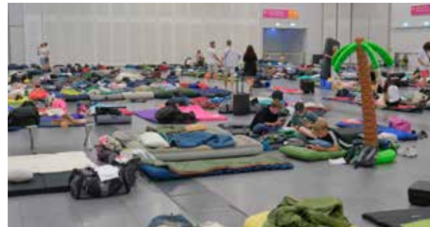
Die Messehalle 2 diente für mehrere hundert Teilnehmer als Schlafsaal. Gleich am Samstagmorgen sicherten sich viele ihren Lieblingsplatz.