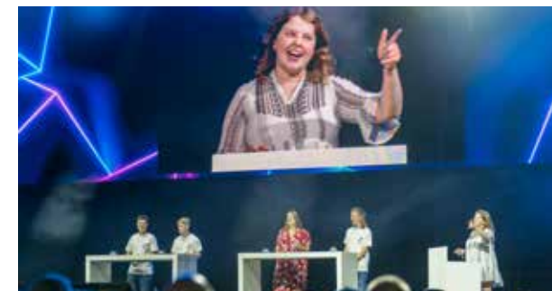
In der Geschichte verfolgte der Protagonist Fernsehshows und Werbeblöcke und entdeckte darin zahlreiche Zeichen, die ihn an seinen Glauben erinnerten.