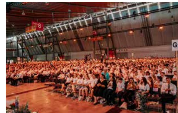
In der großen Messehalle 8 fand der Festgottesdienst am Sonntag statt.

„FÜRCHTE DICH NICHT, DENN ICH HABE DICH ERLÖST; ICH HABE DICH BEI DEINEM NAMEN GERUFEN; DU BIST MEIN! SO FÜRCHTE DICH NUN NICHT, DENN ICH BIN BEI DIR.“ JESAJA 43, VERSE 1 UND 5