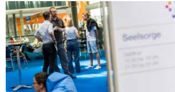
Unter den 20 Aktions- und Infoständen war der Seelsorgestand ein besonderer Anlaufpunkt. Dort konnte über Sorgen und Probleme gesprochen werden.