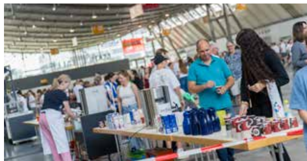
Die Messehalle 4 diente als Cateringhalle, in der Speisen ausgegeben wurden, die sich die Teilnehmer schmecken lassen konnten.