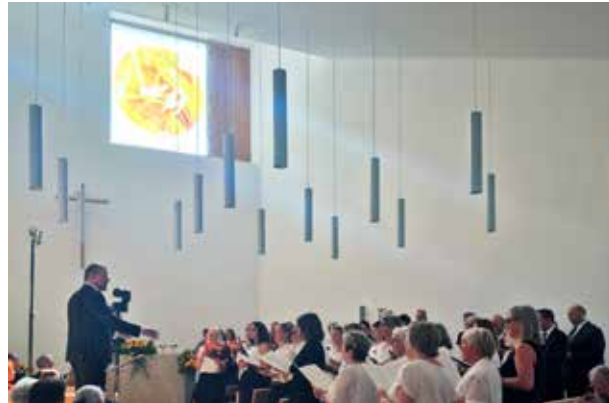
Das Fenster mit der symbolisierten Sonne liegt an der höchsten Stelle der Kirche.

Das neue Kirchengebäude wurde auf dem Grundstück des vorherigen Gotteshauses errichtet. Aufgrund der dreieckigen Grundstücksform und des ausgeprägten Ge-