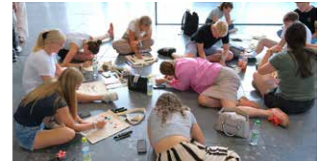
Am Kreativstand wurden Stofftaschen und Shirts bemalt. Der Andrang war so groß, dass die Tische nicht ausreichten und viele auf dem Boden kreativ wurden.