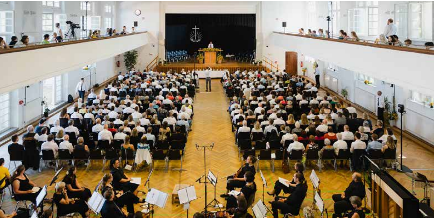
Der Gottesdienst in Regensburg wurde in den gesamten Arbeitsbereich unseres Bezirksapostels übertragen.