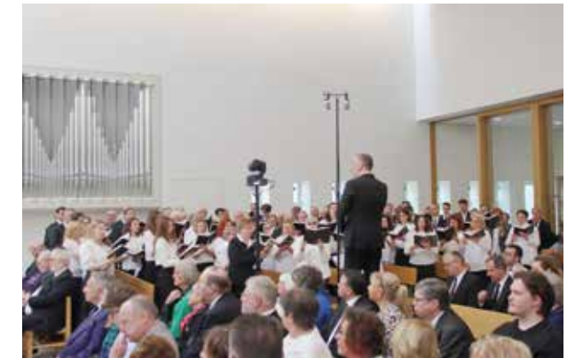
Ein gemischter Chor umrahmte den Gottesdienst feierlich.