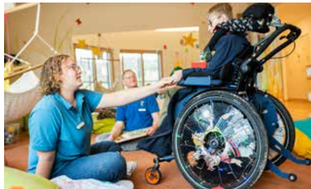
Die Familienherberge in Illingen-Schützlingen bietet eine Auszeit vom Alltag.

und eine Grundschule. Mit dem Förderbetrag wurden neue Leitfäden für die Kindergärten und Schulbücher für die Grundschulen gekauft. Die Eltern sind glücklich und dankbar über die Schulen, denn in der näheren Umgebung beider Einrichtungen gibt es keine anderen Schulen oder Kindergärten. Beide Schulen wurden 2022 von human aktiv erbaut. Die Jörg-Wolff-Stiftung als langjähriger Kooperationspartner hat beide Projekte finanziell gefördert.