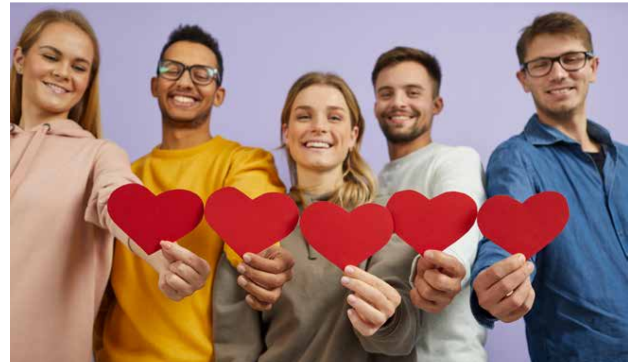
In der Gruppe gemeinschaftlich ein soziales Projekt umzusetzen, bringt allen Beteiligten oft große Freude.

In Altshausen (Kreis Ravensburg) ist ein neues Aufnahmehaus für wohnungslose Frauen eingerichtet worden. Dies ist ein Projekt des Diakonieverbands Dornahof und Erlacher Höhe. Im Aufnahmehaus finden obdachlose Frauen eine zeitlich begrenzte Wohnmöglichkeit. Innerhalb von drei Monaten soll die Lebenssituation analysiert und der weitere Hilfsbedarf geklärt werden, um Wege für die Zukunft zu finden. Das Aufnahmehaus hat dabei eine Lotsenfunktion, beispielsweise in psychiatrische, ärztliche und klinische Hilfen, Pflege, Jugendhilfe, weiterführende Angebote der Wohnungslosen- und Suchthilfe und Hilfen im Arbeitsleben. Anschließend kann in das „Ambulant Betreute Wohnen“ gewechselt werden. Mit der Fördersumme von human aktiv in Höhe von knapp 13.000 Euro wurde die Grundausstattung des Aufnahmehauses bezahlt. Eine Küchenzeile, ein Esstisch, Stühle, die Einrichtung für das Büro und den Beratungsraum konnten gekauft werden.