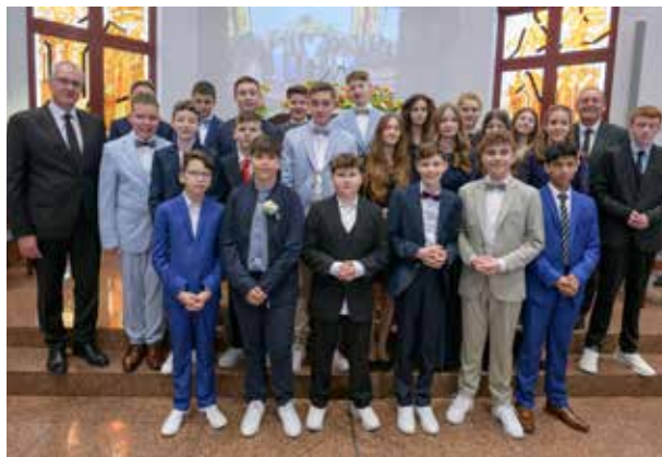
23 junge Christen haben in Karlsruhe-Mitte den Konfirmationssegens erhalten.

Das Bibelwort für die Konfirmanden, das sowohl in den Gottesdiensten mit Konfirmation als auch im Brief des Stammapostels an die Konfirmanden verwendet wurde, stand in Philipper 2, Vers 4: „Und ein jeder sehe nicht auf das Seine, sondern auch auf das, was dem andern dient.“ Ein Bibelwort, das in direktem Zusammenhang mit dem Jahresmotto 2025 der Neuapostolischen Kirche Inter-