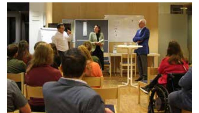
Der Bezirksapostel stellte sich kurzweiligen, aber auch kontroversen Fragen.

Los ging es mit einem bunten Block: „Kaffee oder Tee?“, „Sommer oder Winter?“, „Berge oder Meer?“ Nach seinen Hobbys befragt, nannte der Bezirksapostel in erster Linie Familie, aber auch Sport, Politik und Wirtschaft. „Bodyguard?“ – Das sei nur in gewissen Regionen Afrikas notwendig. Darüber hinaus interessierte die jungen Christen,