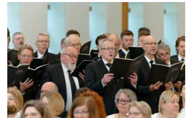
Ein Männerchor erfreute die Zuhörer.