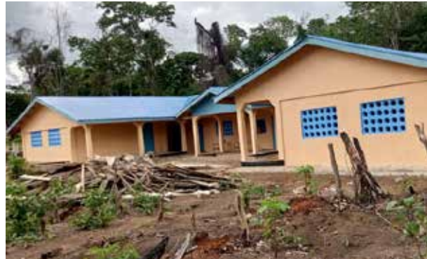
In Afrika werden zahlreiche neue Schulen, Brunnen und Toiletten gebaut.

In Liberia werden zwei Schulen mit der Unterstützung von human aktiv mit neuen Unterrichtsmaterialien ausgestattet. Beide Schulen beherbergen einen Kindergarten