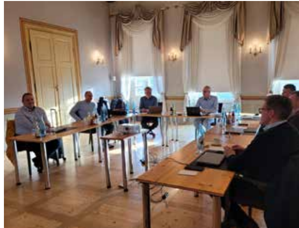
Die sechs süddeutschen Apostel und der Bezirksapostel bei der Versammlung

Ein weiteres Thema der Versammlung war die Umsetzung der bereits beschlossenen Richtlinie für überbezirkliche Ensembles. Diese fördert die musikalische Arbeit in den