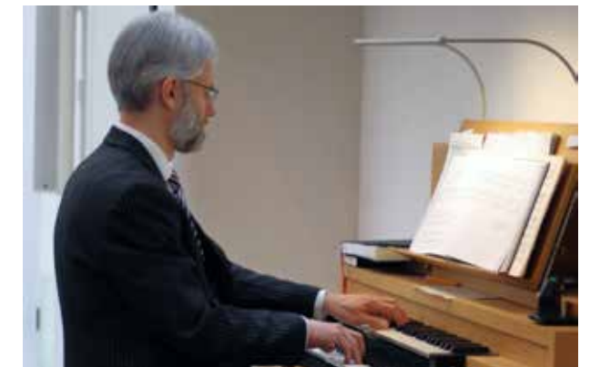
Auch der Organist berührte die Gläubigen mit seinen Beiträgen.