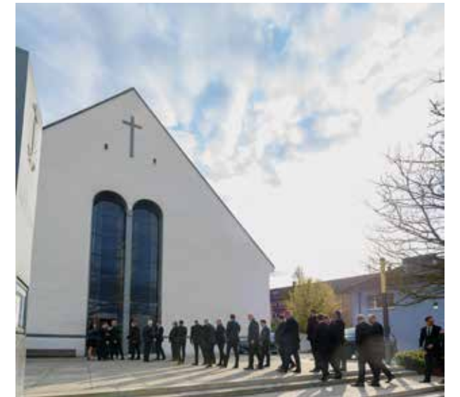
Die süddeutschen Bezirksvorsteher und ihre Stellvertreter zu Gast in Karlsruhe

Am Samstagabend gab es neben einem geistlichen Impuls eine Information des Bezirksapostels zu den personellen Veränderungen im Kreis der Bezirksvorsteher im ver-