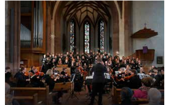
90 Sänger und Spieler haben an zwei Abenden das Publikum begeistert.

Unter der Leitung von Frank Ellinger probten die Sänger des Jungen Chors – alle unter 35 Jahre alt – an mehreren Probenwochenenden. Für die Aufführung wurden erfahrene Solisten ausgesucht und ein Orchester eigens für die Konzerte zusammengestellt, um einen stimmungsvollen barocken Klang zu erhalten. Am Ende waren es mehr als 90 Laiensänger, Instrumentalisten und Solisten, die am 5. April in der Crailsheimer Johanneskirche und am 6. April in der Stuttgarter Leonhardskirche auftraten.