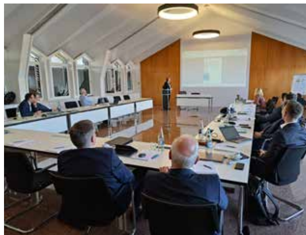
Die Apostel und Bischöfe besprechen und beraten sich mehrmals im Jahr.