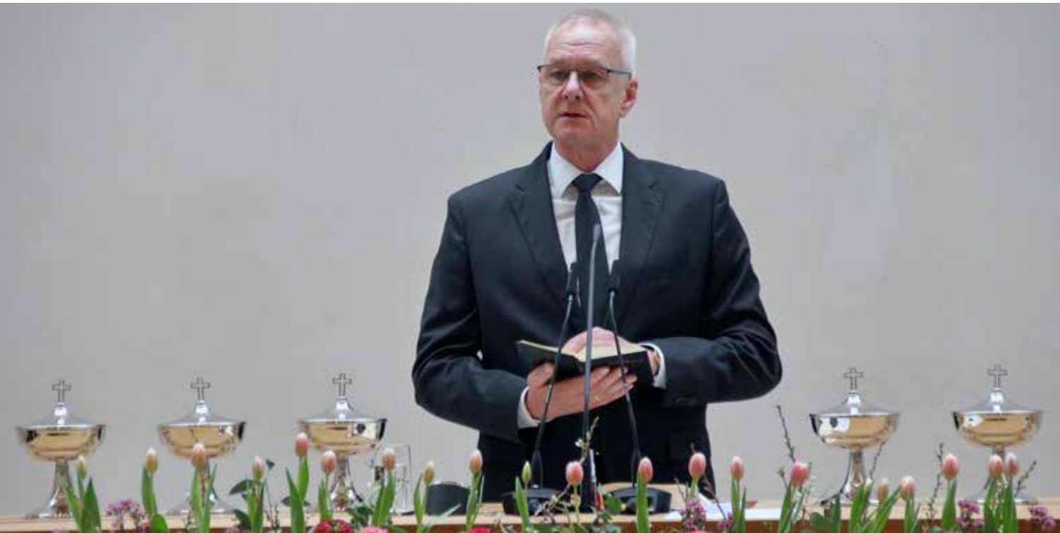
Der Gottesdienst in München-Laim konnte im europäischen Arbeitsbereich des Bezirksapostels mitgefeiert werden.

Am Sonntag, 23. März 2025, feierte unser Bezirksapostel in München-Laim einen Gottesdienst. Begleitet wurde er von allen süddeutschen Aposteln und Bischöfen. Der Gottesdienst konnte im europäischen Arbeitsbereich des Bezirksapostels sowie über Youtube mitgefeiert werden. Grundlage des Gottesdienstes war ein Bibelwort aus Lukas 9, Vers 23: „Da sprach er zu allen: Wer mir folgen will, der verleugne sich selbst und nehme sein Kreuz auf sich täglich und folge mir nach.“