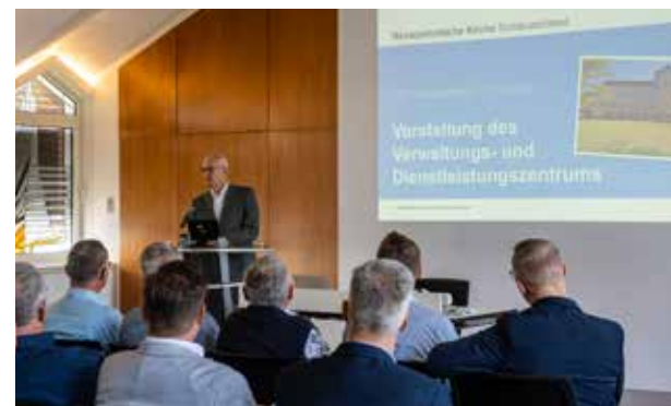
Die Aufgabenbereiche und Strukturen im VDZ wurden erläutert.

Der Vormittag begann mit einer Begrüßung durch den Bezirksapostel. Er gab einen umfassenden Einblick in die Aufgabenbereiche des VDZ und erläuterte die Strukturen sowie die Zusammenarbeit mit den Kirchengemeinden. Anschließend hatten die Teilnehmer die Möglichkeit, an verschiedenen Workshops teilzunehmen. Diese konzentrierten sich insbesondere auf die Schnittstellen zwischen den Kirchengemeinden und den Fachabteilungen des VDZ. Dabei standen vor allem technische Systeme und digitale Anwendungen im Fokus, die den Vorstehern zur Verfügung stehen, um ihre Arbeit zu unterstützen und zu erleichtern.