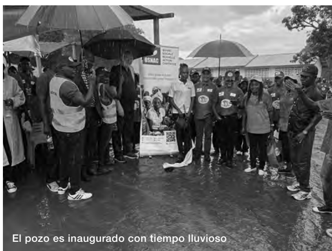
El pozo es inaugurado con tiempo lluvioso

Tras la colonización, el país se sumió en numerosas crisis y actualmente luchan entre sí rebeldes y milicias. La paz es casi imposible, las pérdidas y el deseo de venganza de