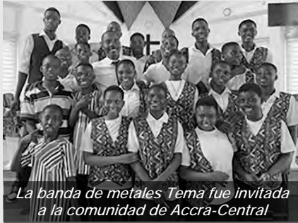
La banda de metales Tema fue invitada a la comunidad de Accra-Central

A finales de 2023, la comunidad de Tema decidió fundar una banda de música. Sin embargo, surgió un desafío: los fondos necesarios para financiar el conjunto, comprar instrumentos y contratar un profesor eran limitados. El rector rogó para que se recaudasen fondos. Sin su conocimiento, dos hermanos aceptaron apoyar el proyecto. Hoy en día, la Banda Tema es un brillante ejemplo de confianza en nuestro Padre Celestial. Él puede tocar corazones y brindar ayuda.