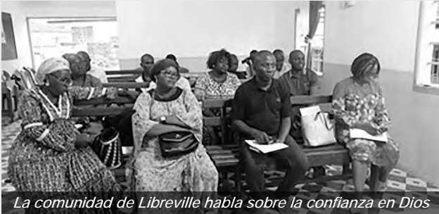
La comunidad de Libreville habla sobre la confianza en Dios