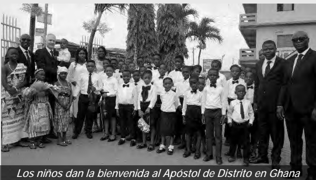
Los niños dan la bienvenida al Apóstol de Distrito en Ghana

El 22 de enero, el Apóstol de Distrito Michael Ehrich celebró un servicio divino festivo en Lomé, Togo. Su viaje lo llevó luego a Cotonú, Benin. Allí celebró otro servicio divino el 23 de enero. Su última parada fue Accra, capital de Ghana, donde celebró un encuentro de Apóstoles y Obispos. El momento culminante fue el servicio divino festivo en la Iglesia Central de Accra el domingo 25 de enero. Durante su viaje a Togo, Benin y Ghana, el Apóstol de Distrito jubiló a 15 ministros de distrito y nombró a 27 nuevos.