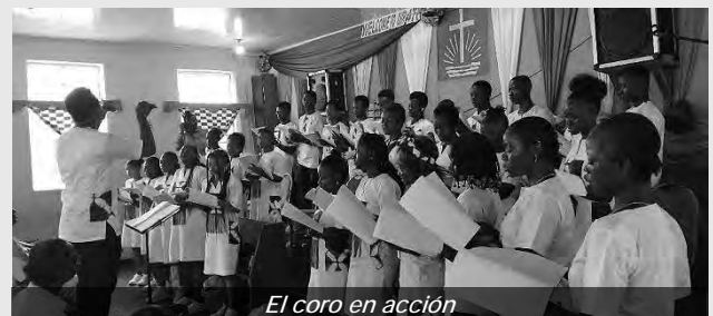
El coro en acción