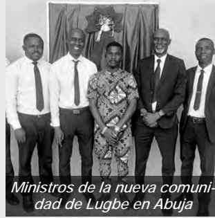
Ministros de la nueva comunidad de Lugbe en Abuja

Nuestros hermanos y hermanas de la comunidad de Abuja en Nigeria han estado orando durante muchos años por una nueva ubicación cerca de la autopista del aeropuerto, dada la distancia entre sus hogares y la iglesia más cercana. La fe y la confianza en Dios de los hermanos y hermanas Lugbe fueron recompensadas: