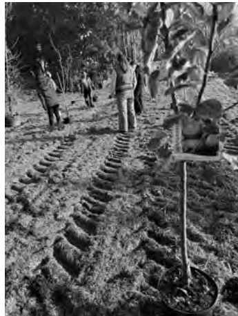
Los jóvenes plantan árboles