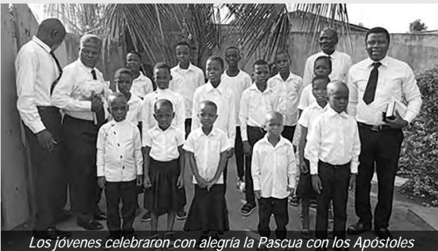
Los jóvenes celebraron con alegría la Pascua con los Apóstoles

Del sábado 19 al domingo 20 de abril, hermanos y hermanas de los barrios de Comé y Grand-Popo se reunieron para celebrar la Pascua. El tema fue “Confiemos en Dios”. El domingo se celebró un servicio divino festivo a cargo del Apóstol principal Vincent Yedenou, asistido por el Apóstol Justin Olou. El texto fue tomado de Génesis 15:6: “ De nuestra confianza en Cristo sacamos la fuerza para permanecer firmes en el camino que conduce al reino de los cielos ”. Al finalizar el servicio divino, los jóvenes y las mujeres animaron la jornada con diversas actividades folclóricas.