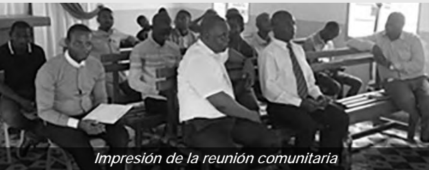
Impresión de la reunión comunitaria

Para fortalecer su fe, hermanos y hermanas de Libreville se reunieron para compartir sus experiencias sobre la “confianza en Dios”. Liderados por los ministros de distrito, los participantes aprendieron que confiar en Dios significa depender de Él completamente, incluso sin resultados, según Proverbios 3:5-6. Se destacaron tres cualidades de un creyente seguro: fidelidad, esperanza y amor. A través de testimonios vividos, los fieles han comprendido que confiar en Dios trae paz, fuerza, estabilidad y atrae el favor divino.