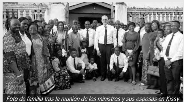
Foto de familia tras la reunión de los ministros y sus esposas en Kissy

El 3 de abril de 2025, el Apóstol de Distrito Ehrich visitó Bo, donde celebró un Servicio Divino. Se han nombrado o asignado ministros de Liberia y de esta región del país como rectores y ayudantes rectores de distrito. El 4 de abril, los Apóstoles y sus esposas se reunieron en Kissy para discutir las responsabilidades comunitarias y la preparación para el regreso de Cristo. La visita concluyó el 5 de abril con un concierto en Goderich y un servicio divino festivo en Freetown, transmitido por YouTube. Algunos ministros de distrito han sido nombrados y asignados como ministros de distrito.