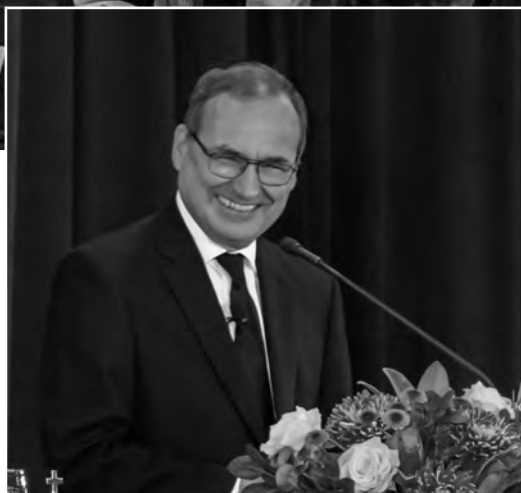
El Apóstol Mayor Jean-Luc Schneider celebró el 13 de octubre de 2024 un Servicio Divino en San Francisco (EE. UU.)