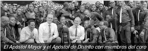
El Apóstol Mayor y el Apóstol de Distrito con miembros del coro

El 1 de marzo, el día antes de la celebración, varios conjuntos dieron un concierto festivo en el Parque de la Libertad en Lagos, para resaltar la importancia de pensar a los muertos.