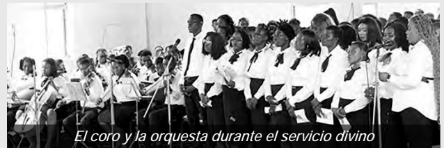
El coro y la orquesta durante el servicio divino

El 2 de marzo, más de 2.000 personas asistieron al servicio divino especial en la Iglesia Central de Lagos, que se transmitió a todo el país. El sermón del Apóstol Mayor se centró en Génesis 50:20: "Ustedes han tramado el mal contra mí, pero Dios lo transformó en bien, para hacer lo que hoy sucede, para salvar la vida de mucha gente. Los buenos planes de Dios se extienden tanto a los vivos como a los muertos." El Apóstol Mayor destacó la historia de José como ejemplo de fe y perdón, instando a los creyentes a confiar en las promesas de Dios y permanecer fieles. También se administraban sacramentos a los difuntos