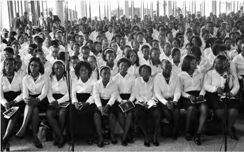
Gran alegría por la visita del Apóstol Mayor y los Apóstoles de Distrito en Acra (Ghana)

No obstante, está claro que la sociedad no puede funcionar sin justicia. Los que hacen el mal pueden ser perdonados, pero aun así tienen que afrontar las consecuencias de sus actos. Aquí el Apóstol Mayor se refirió al malhechor que fue crucificado junto a Jesús. Aunque Cristo le había concedido el perdón y la gracia, “el hombre tuvo que sufrir y morir porque había hecho algo malo y fue condenado por la sociedad”.