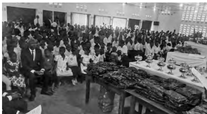
La necesidad y la pobreza abundan en la República Centroafricana, por eso la organización de ayuda OSNAC distribuye artículos de primera necesidad a los necesitados

colaboradores distribuyeron artículos no alimentarios. Los kits contenían utensilios de cocina, productos de higiene y medicamentos que se necesitaban con urgencia. Sobre el terreno, los colaboradores se mantuvieron alertas para ver si podían organizar cualquier otra ayuda que fuera necesaria. En las zonas más afectadas, la OSNAC pudo ayudar a 200 víctimas de las inundaciones con los kits y proporcionar asistencia adicional a 50 personas especialmente afectadas. Todo ello fue posible gracias a una donación de la Iglesia Nueva Apostólica de la República Centroafricana.