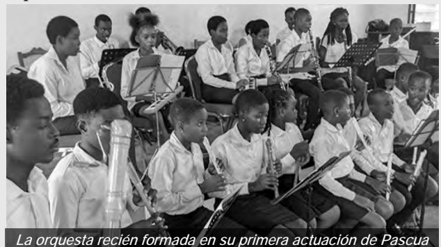
La orquesta recién formada en su primera actuación de Pascua

A pesar del escepticismo inicial, el proyecto musical se construyó sobre la confianza en Dios. Los primeros pasos de la orquesta estuvieron dedicados a la formación teórica, la introducción a la notación musical y el aprendizaje de instrumentos. La orquesta dio su primera actuación pública en Pascua, utilizando la música como medio para expresar su confianza en Dios.