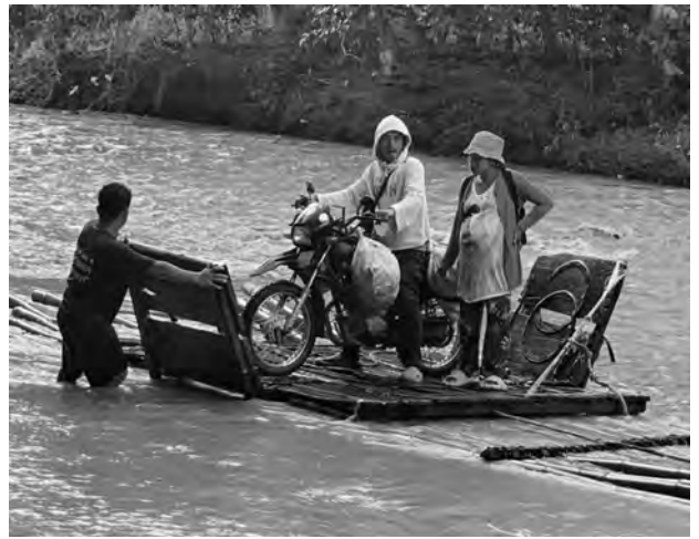
Semillas para las aldeas distantes

Ni el mal tiempo ni la falta de carreteras han impedido a los colaboradores de NAC SEA Relief entregar semillas a los necesitados. En nombre de la organización de ayuda alemana NAK-karitativ, los colaboradores filipinos se pusieron en camino para llevar semillas de maíz a los agricultores y sus familias en zonas remotas. Porque para conseguir “el pan nuestro de cada día” hay que superar muchos retos antes de que los agricultores puedan empezar a sembrar y cosechar. En una reunión comunitaria en Sebu-See