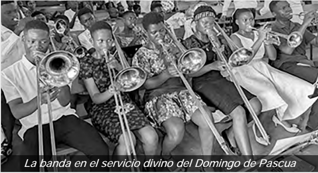
La banda en el servicio divino del Domingo de Pascua