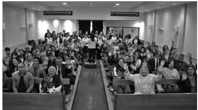
Celebrando el aniversario de la comunidad