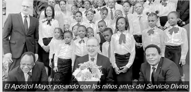
El Apóstol Mayor posando con los niños antes del Servicio Divino