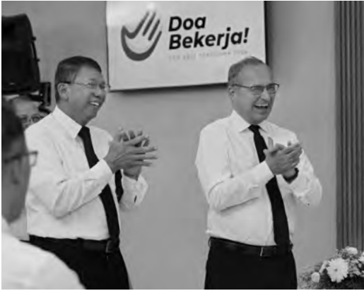
El Apóstol Mayor bien cerca: Servicio Divino en Denpasar