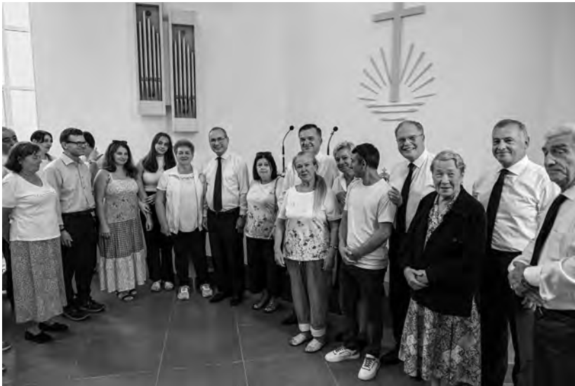
Foto grupal después del Servicio Divino

que Dios está callado o que descansa. Pero Él os dice: ‘Yo te amo, y nada ha cambiado en mi amor por ti’.