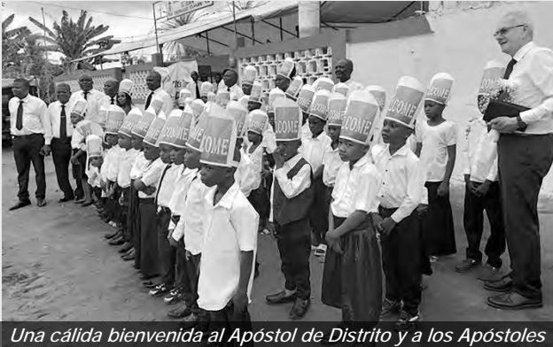
Una cálida bienvenida al Apóstol de Distrito y a los Apóstoles