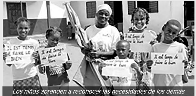
Los niños aprenden a reconocer las necesidades de los demás