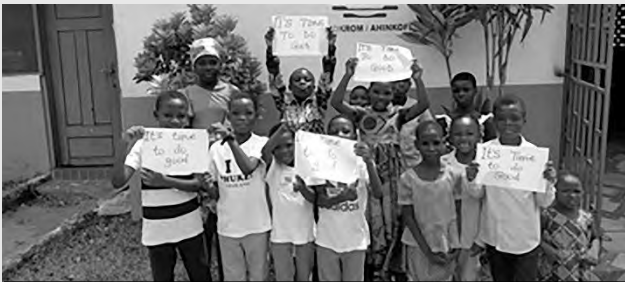
Los niños cariñosos muestran al mundo: “Es tiempo de hacer el bien”