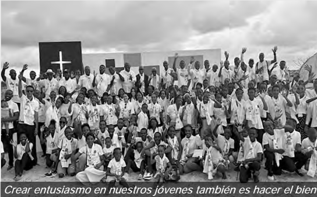
Crear entusiasmo en nuestros jóvenes también es hacer el bien