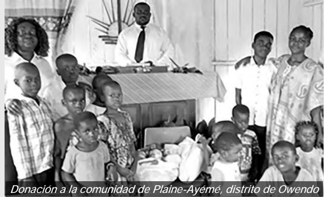
Donación a la comunidad de Plaine-Ayéme, distrito de Owendo

1) En cuidar la misión a la que hemos sido llamados con nuestros diferentes talentos. 2) En predicar el Evangelio que le es enseñado por el apostolado y con autoridad divina. 3) En cuidar especialmente de los niños y jóvenes que salen de la Iglesia, para que puedan llegar a ser miembros vivos. 4) En ayudar a quienes están en necesidad del amor divino, como la persona, sus orígenes y sus creencias. 5) En visitar a las familias para que cada miembro de la familia sea una carta visible de Cristo en la sociedad.