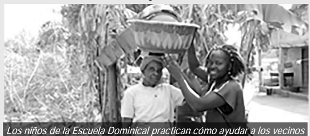
Los niños de la Escuela Dominical practican cómo ayudar a los vecinos