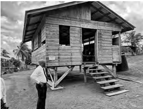
La iglesia en Akawini está erigida sobre una colina, de modo que todos en la isla la pueden ver

Guyana, la “tierra de las muchas aguas”, vive de la agricultura y la minería. El descubrimiento de petróleo en 2015 trajo al país un fuerte crecimiento económico. La mayoría de los guyaneses viven en las ciudades cercanas a la costa; solo unos pocos, principalmente los indígenas sudamericanos, viven en el interior. No hay carreteras, ni tendido eléctrico, y solo en contadas ocasiones se encuentra una antena de