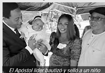
El Apóstol líder bautizó y selló a un niño

La comunidad GRA en Nigeria experimentó un servicio divino festivo con el Apóstol líder Oscar Nwanza. Él utilizó las palabras de Eclesiastés 11:4: “El que al viento mira, no sembrará; y el que mira a las nubes, no segará.” El Apóstol líder explicó: “Esto ilustra un aspecto de nuestro lema para el año. ¡No esperemos a que se den las condiciones perfectas para actuar! Seamos proactivos en hacer el bien y servir al Señor. El