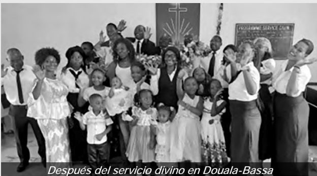
Después del servicio divino en Douala-Bassa

La Iglesia Nueva Apostólica en Gabón no ha esperado al Año Nuevo para hacer el bien para poner en práctica el lema de 2025: “¡Es tiempo de hacer el bien!”. La Escuela Dominical y el grupo de mujeres “Les Mères de Sarepta” de la comunidad de Angondjé ya han manifestado su deseo de compartir la alegría con los niños y padres de familias desfavorecidas. Así hicieron el bien durante la celebración de Navidad de 2024. Para celebrar la ocasión, se organizó una recaudación de fondos en forma de ropa y alimentos para niños pobres y familias indigentes de comunidades rurales. En los distritos de Libreville y Owendo se ha ayudado a muchas personas necesitadas, por ejemplo en las comunidades de Bolokoboué, Plaine-Ayéme, Nzamaligué y Santa-Clara.