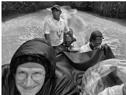
Con el bote va más rápido, pero también es más peligroso