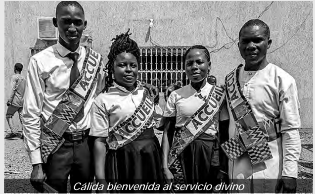
Cálida bienvenida al servicio divino