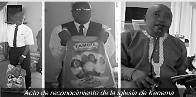
Acto de reconocimiento de la iglesia de Kenema

Hacer el bien es reflejar la luz de Cristo, difundir la paz y mostrar misericordia. Las comunidades nuevoapostólicas en Togo están comprometidas en esta misión con fe y devoción. Los fieles hacen grandes sacrificios para experimentar los servicios divinos. Viajan largas distancias para hacer el bien a sus almas y recibir la gracia de Dios.