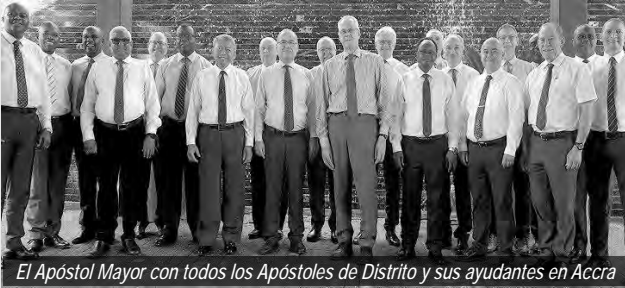
El Apóstol Mayor con todos los Apóstoles de Distrito y sus ayudantes en Accra