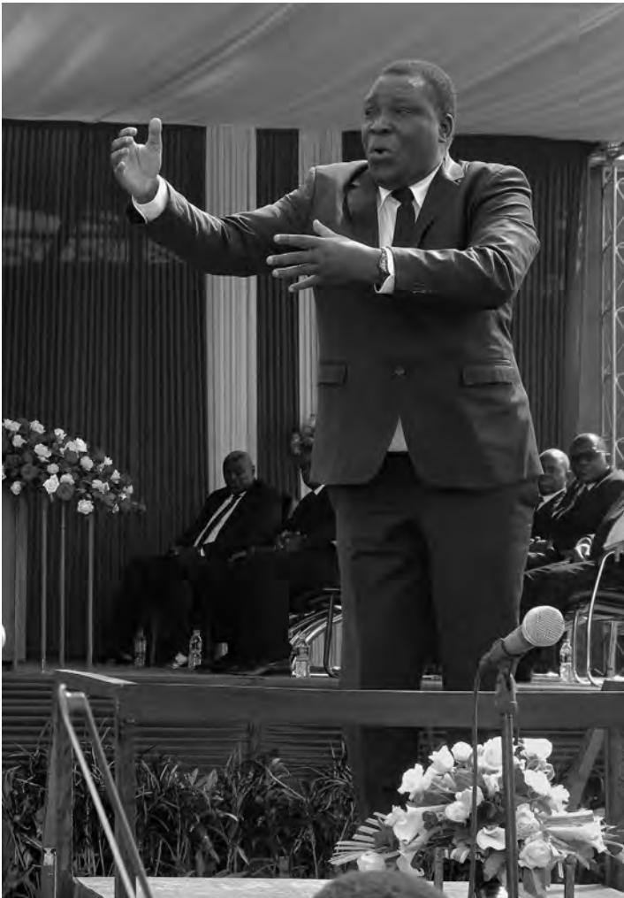
El Servicio Divino tuvo un hermoso marco musical

por vosotros mismos. No os preocupéis solo por vuestra propia salvación. Pensad en la salvación de vuestro prójimo. Acércate a los demás, muéstrales el camino para que sepan que este es el lugar al que tienen que ir. Este es el lugar donde Dios habita con su pueblo. Este es el lugar donde podemos encontrar la salvación. Es en esta dirección que tenemos que ir.