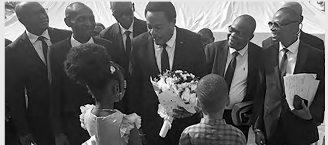
Dando la bienvenida al Apóstol líder a la comunidad de GRA