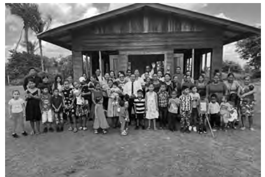
En Wakapau, los hermanos y hermanas están orgullosos de su iglesia construida por ellos mismos