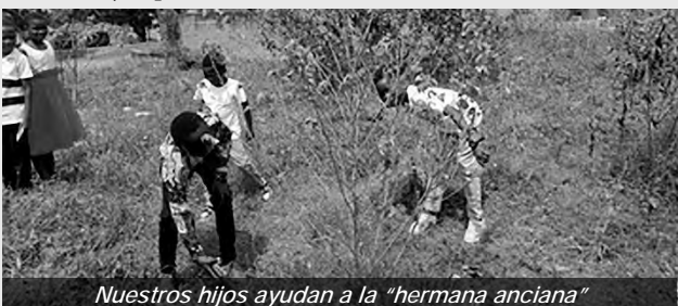
Nuestros hijos ayudan a la “hermana anciana”

En la zona del Apóstol Takoradi, nuestros niños de la Escuela Dominical ponen en práctica el lema a través de juegos de roles. Los niños de la escuela dominical actuaron cómo ayudar a una vecina anciana con su jardinería. Con carteles con nuestro lema, los niños demostraron su comprensión y compromiso de difundir la bondad y la compasión. Este acto conmovedor es un brillante ejemplo de nuestro lema en acción.