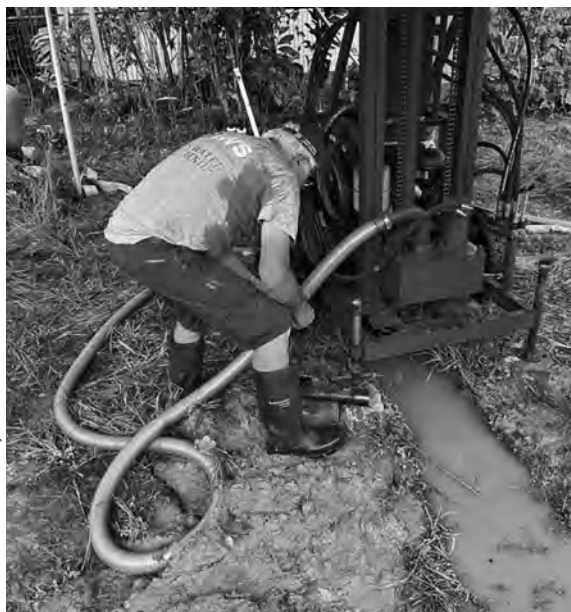
Arie van der Linden durante la instalación de una de las máquinas perforadoras