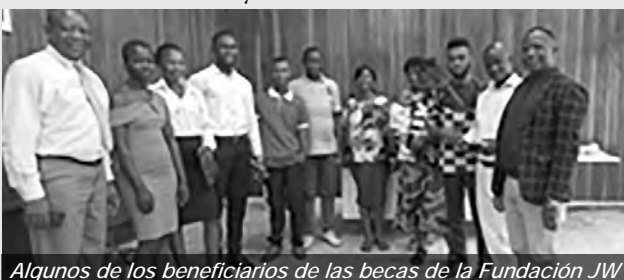
Algunos de los beneficiarios de las becas de la Fundación JW

Los hermanos y hermanas de Guinea también quieren aprovechar el tiempo para hacer el bien. Esto también significa que no debemos esperar para actuar con bondad y benevolencia. Cada momento es una oportunidad para ayudar a los demás, ser justos y difundir el bien a nuestro alrededor. Esto nos recuerda lo importante que es actuar sin posponer las buenas acciones que podemos hacer hoy. Cualquiera que sea nuestra edad o situación. Los niños practicaron esto en la escuela dominical haciendo representaciones de roles.