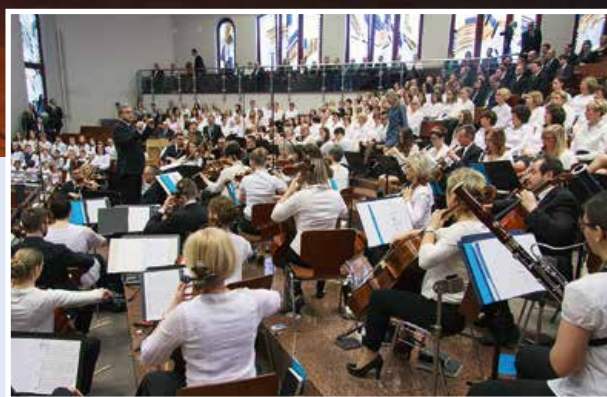
Musikalische Mitgestaltung des Stammapostel-Gottesdienstes in Karlsruhe