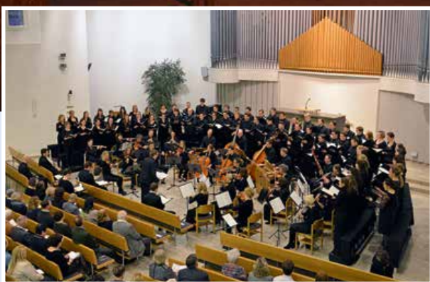
„Matthäus-Passion“, aufgeführt in der Kirche Reutlingen-West