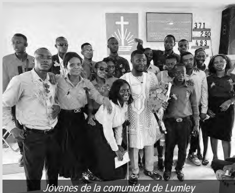
Jóvenes de la comunidad de Lumley

y el servicio juvenil de Marjay Town, así como el servicio juvenil en la comunidad de Lumley en Freetown. Otro aspecto es el establecimiento de escuelas de la Iglesia Nueva Apostólica (apoyadas por el gobierno) con la ayuda de la Fundación Jorg Wolff. Unas 24 escuelas tienen edificios permanentes, mientras que otras están en estructuras temporales. Los niños en edad de escuela primaria y secundaria en sus comunidades tienen la oportunidad de aprender.