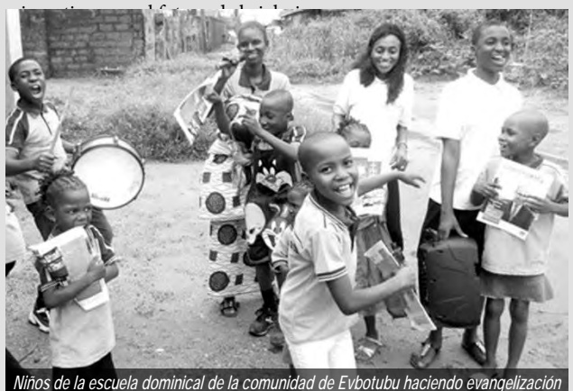
Niños de la escuela dominical de la comunidad de Ebotubu haciendo evangelización