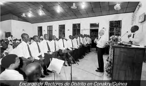
Encargo de Rectores de Distrito en Conakry/Guinea