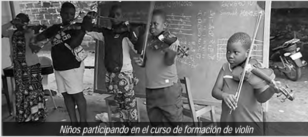
Niños participando en el curso de formación de violín