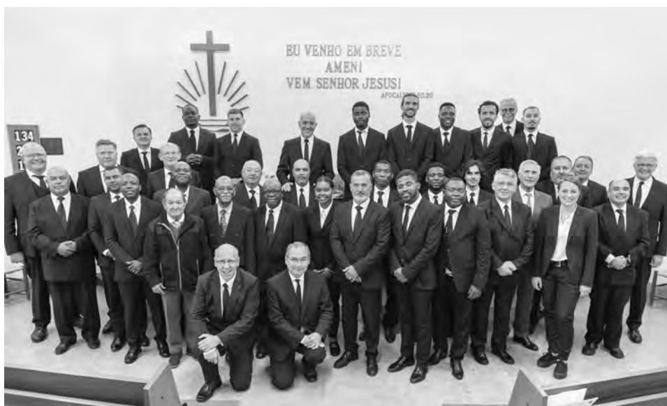
También hubo tiempo para una foto grupal

más allá y se dieron cuenta: “Todo eso es totalmente inútil”. Pensemos en los creyentes. Creían en Dios, leían la Biblia y hacían buenas obras. Luego llegaron al más allá y se dieron cuenta: “¡Eso no es suficiente!” Les falta el renacimiento de agua y del Espíritu, los Sacramentos dispensados por los Apóstoles.