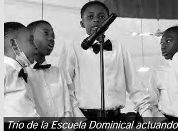
Trio de la Escuela Dominical actuando

La comunidad de Accra Central es rica en talento musical de todas las edades. Esto ha llevado a la creación e incorporación del coro de la Escuela Dominical en los servicios divinos de la iglesia unida. El coro de la escuela dominical, que comprende más de 30 niños, canta junto con el coro principal. Estos niños se nutren a través de ensayos regulares del coro después de los servicios divinos dominicales. Se los está preparando para roles futuros.