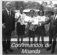
Confirmandos de Moanda

Los confirmandos ya están aprendiendo a modelar el futuro con Jesucristo. Para que nuestro Señor Jesús pueda estar con nosotros, primero debemos seguirlo, porque él es el camino, la verdad y la vida (Juan 14,6). Este fue el mensaje especial dirigido a los confirmandos de este año. Jesucristo es la verdad, nos ama y también ama a nuestro prójimo. Todos estamos invitados a seguir a nuestro Señor Jesús practicando la fe también a través de nuestras obras, así como apoyándonos unos a otros en el camino que lleva a la comunión eterna con Dios.