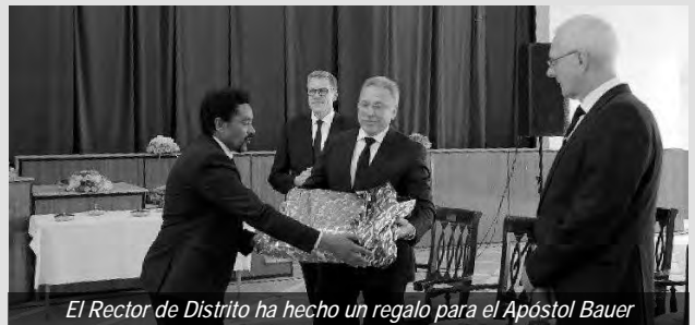
El Rector de Distrito ha hecho un regalo para el Apóstol Bauer