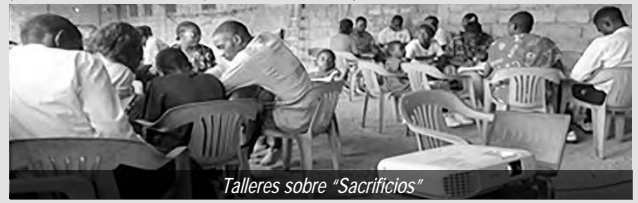
Talleres sobre "Sacrificios"

Los jóvenes que se enfrentan a los desafíos del mundo moderno necesitan una formación continua para aumentar la motivación a través del conocimiento y aumentar el compromiso a través de la fe. Para lograr estos objetivos, se organizan periódicamente encuentros mensuales de jóvenes en el distrito. El 27 de julio de 2024, el encuentro se celebró en Yaundé, en la comunidad de Omnisport (Yaundé-Camerún) con una asistencia de unos 100 jóvenes como prelude a la celebración de la gran jornada nacional de la juventud 2025 cuya ciudad anfitriona será Kribi.