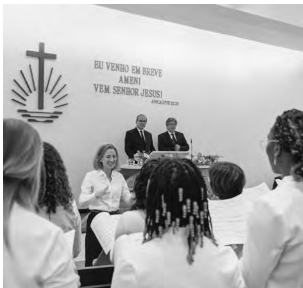
Alegria por la visita del Apóstol Mayor a Portugal