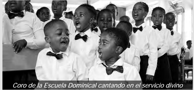
Coro de la Escuela Dominical cantando en el servicio divino