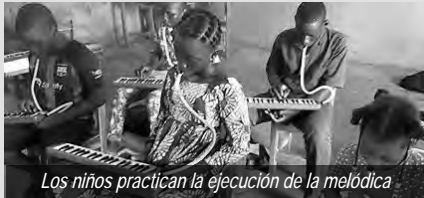
Los niños practican la ejecución de la melódica

¡Se dice que un niño que aprende es un hombre que gana! Para lograrlo, varios distritos, con el objetivo de convertir a los niños de hoy en cristianos comprometidos y verdaderos servidores de Cristo en el futuro, han iniciado cursos de teoría musical, melódica y violín para niños. Esta fue una oportunidad para que los niños, que vinieron en delegaciones de todas las comunidades, se conocieran mejor, compartieran sus diversos conocimientos y despertaran los talentos de los demás. Durante estas sesiones de formación, se reservó tiempo para compartir con los niños clases de escuela dominical y/o catecismo para su crecimiento espiritual.