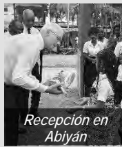
Recepción en Abiyán