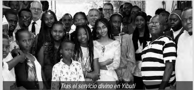
Tras el servicio divino en Yibuti