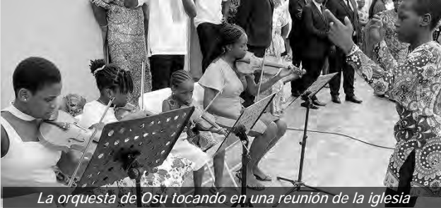
La orquesta de Osu tocando en una reunión de la iglesia