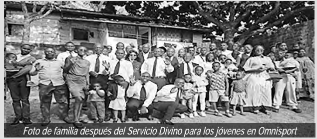
Foto de familia después del Servicio Divino para los jóvenes en Omnisport