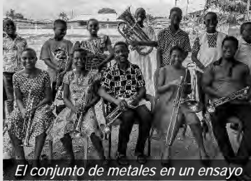
El conjunto de metales en un ensayo

Al utilizar los talentos disponibles, no solo se glorifica a Dios, sino que también se eleva a la comunidad y su futuro también se moldea a través de la música.