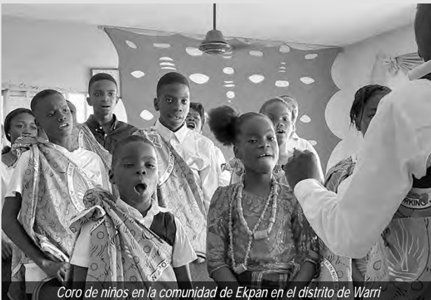
Coro de niños en la comunidad de Ekpan en el distrito de Warri

Al involucrar a los niños en la iglesia, seguimos los ejemplos bíblicos