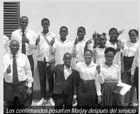
Los confirmandos posan en Marjay después del servicio