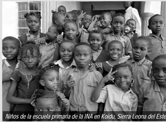
Niños de la escuela primaria de la INA en Koidu, Sierra Leona del Este

En un esfuerzo por tener un futuro exitoso, los niños asisten a escuelas dominicales, asisten a clases de confirmación y se unen al coro / grupos de jóvenes. A nivel de congregación y distrito, hay servicios especiales para niños / jóvenes donde se muestran muchos talentos: teatro, música, recitación de poemas/artículos, etc. Los eventos recientes han sido la confraternidad de niños en la comunidad de Jui, la confirmación en Marjay Town