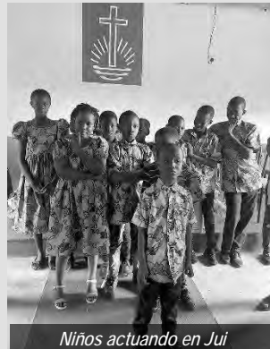
Niños actuando en Jui