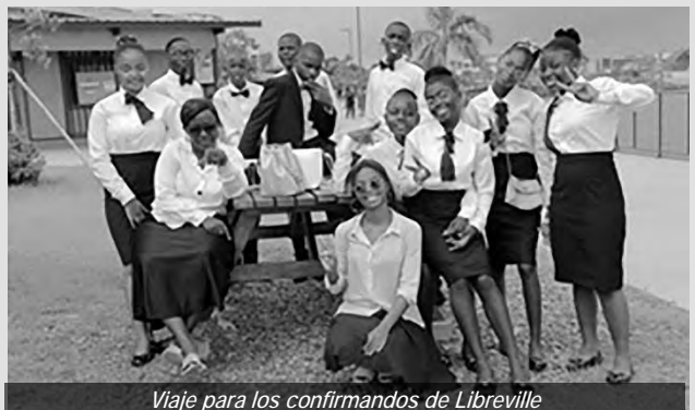
Viaje para los confirmandos de Libreville