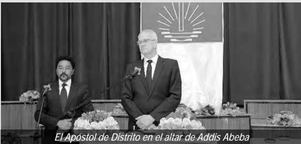
El Apóstol de Distrito en el altar de Addis Abeba

momento de despedirse. Había trabajado como Obispo y Apóstol en África Oriental durante 27 años. El Apóstol Mayor Jean-Luc Schneider lo puso en retiro el 28 de julio de 2024. El Apóstol de Distrito transfirió la responsabilidad de los creyentes en Yibuti y Etiopía al Obispo Keck, quien fue ordenado Apóstol por nuestro Apóstol Mayor en el mismo Servicio Divino el 28 de julio de 2024.