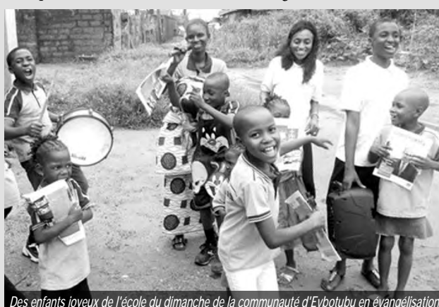
Des enfants joyeux de l'école du dimanche de la communauté d'Evbotubu en évangélisation