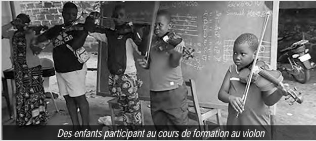
Des enfants participant au cours de formation au violon