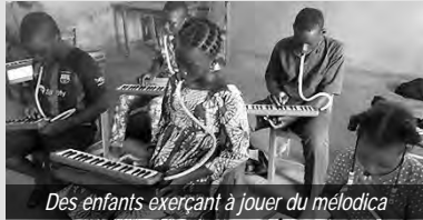
Des enfants exerçant à jouer du mélodica

On dit qu'un enfant instruit est un homme gagné ! Pour y parvenir, plusieurs districts, dans le but de faire des enfants d'aujourd'hui des chrétiens engagés et de futurs véritables serviteurs du Christ, ont initié des cours de formation au solfège, au mélodica et au violon pour les enfants. Ce fut l'occasion pour les enfants, venus en délégations de toutes les communautés, de mieux se connaître, de partager leurs diverses connaissances et d'éveiller les talents des uns et des autres. Au cours de ces sessions de formation, un temps a été réservé pour partager avec les enfants des cours d'école du dimanche et / ou de catéchisme pour leur croissance spirituelle.