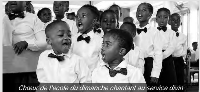
Chœur de l'école du dimanche chantant au service divin