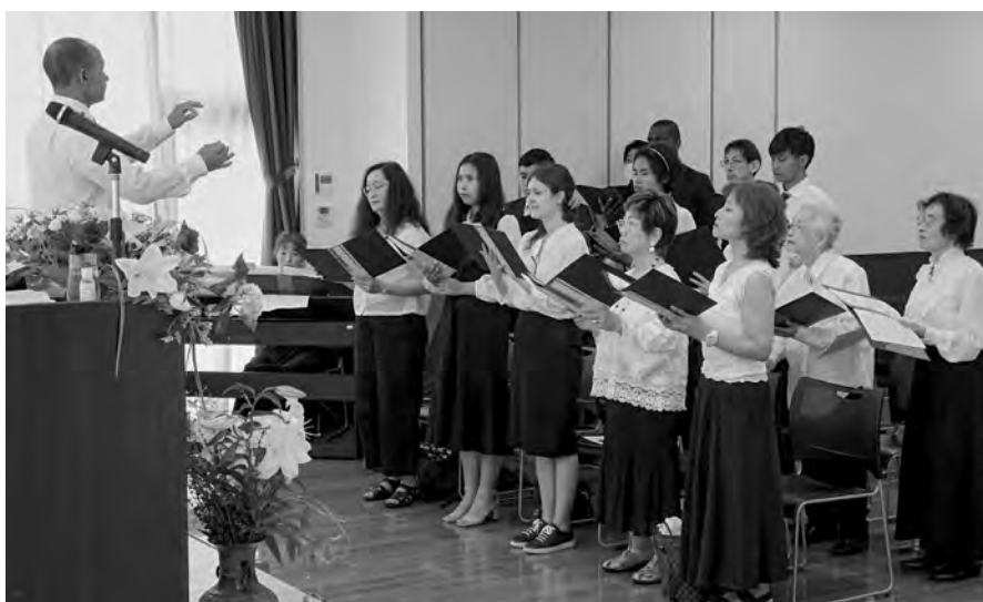
L'apôtre de district Edy Isnugroho (Asie du Sud-Est) a parlé du choix en faveur de Dieu

Lorsque nous sommes confrontés à des épreuves ou à des situations difficiles, nous devrions être conscients que la solution finale et véritable est le retour de Christ. Dieu veut nous rendre bienheureux. Il veut nous libérer de toutes les tribulations, de toutes les détresses et nous accueillir dans son royaume.