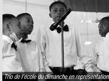
Trio de l'école du dimanche en représentation

La communauté d'Accra-Centrale est riche en talents musicaux de tous âges. Cela a conduit à la création et à l'intégration de la chorale de l'école du dimanche dans les services divins unifiés de l'église. La chorale de l'école du dimanche, composée de plus de 30 enfants, chante aux côtés de la chorale principale. Ces enfants sont nourris par des répétitions régulières de la chorale après les services divins du dimanche. Ils sont préparés à leurs futurs rôles.