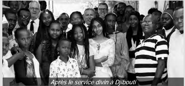
Après le service divin à Djibouti