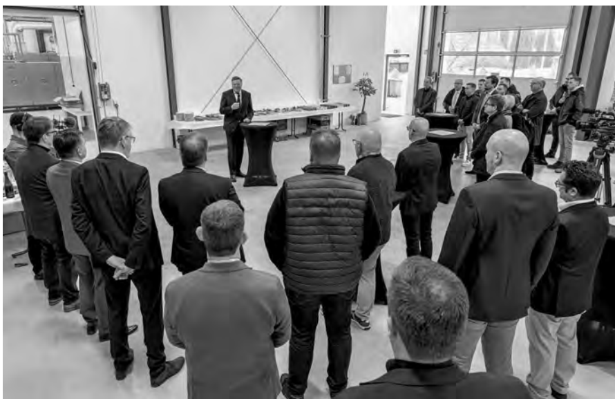
Lors de l'acte festif à l'occasion de l'inauguration