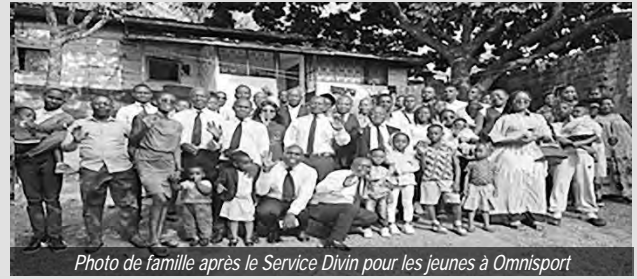
Photo de famille après le Service Divin pour les jeunes à Omnisport