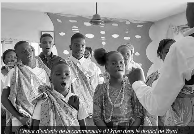
Chœur d'enfants de la communauté d'Ekpan dans le district de Warri