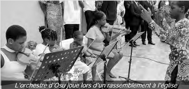
L'orchestre d'Osù joue lors d'un rassemblement à l'église