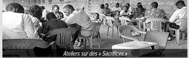
Ateliers sur des « Sacrifices »

Les jeunes confrontés aux défis du monde moderne ont besoin d'une formation continue pour accroître leur motivation par la connaissance et accroître leur engagement par la foi. Dans la poursuite de ces objectifs, des rassemblements mensuels et trimestriels de jeunes dans le district sont régulièrement organisés. Le 27 juillet 2024, le rassemblement trimestriel s'est tenu à Yaoundé, à la communauté d'Omnisport (Yaoundé-Cameroun) avec une participation d'environ 100 jeunes en prélude à la tenue de la grande journée nationale de la jeunesse 2025 dont la ville hôte sera Kribi.