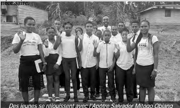
Des jeunes se réjouissent avec l'Apôtre Salvador Mitogo Obiang