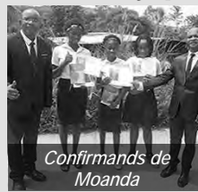
Confirmands de Moanda

Les confirmands apprennent déjà à façonner l'avenir avec Jésus Christ. Pour que notre Seigneur Jésus puisse être avec nous, nous devons d'abord le suivre, car il est le chemin, la vérité et la vie (Jean 14:6). C'était le message spécial adressé aux confirmands de cette année.