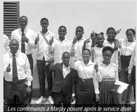
Les confirmands à Marjay posent après le service divin