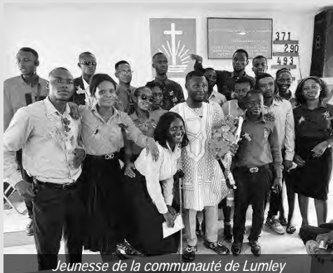
Jeunesse de la communauté de Lumley

Town et le service des jeunes à Marjay Town ainsi que le service des jeunes dans la congrégation de Lumley à Freetown. Un autre aspect est la création d'écoles de l'Église néo-apostolique (soutenues par le gouvernement) avec l'aide de la Fondation Jorg Wolff. Quelque 24 écoles disposent de bâtiments permanents, tandis que d'autres sont dans des structures temporaires. Les enfants en âge d'aller à l'école primaire et secondaire de leurs communautés ont la possibilité d'apprendre.