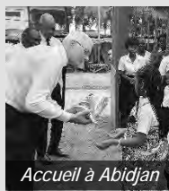
Accueil à Abidjan