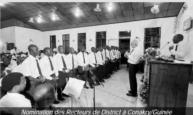
Nomination des Recteurs de District à Conakry/Guinée