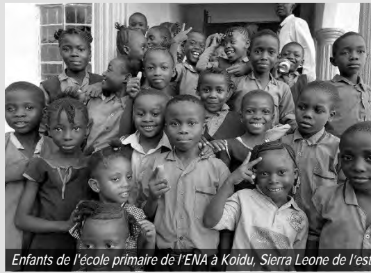
Enfants de l'école primaire de l'ENA à Koidu, Sierra Leone de l'est

Pour s'assurer un avenir prospère, les enfants fréquentent l'école du dimanche, suivent des cours de confirmation et rejoignent la chorale / les groupes de jeunes. Au niveau de communauté et du district, des services spéciaux pour les enfants / jeunes sont organisés où de nombreux talents sont mis en valeur : théâtre, musique, récitation de poèmes / articles, etc. Les événements récents ont été la communion des enfants dans la congrégation de Jui, la confirmation à Marjay