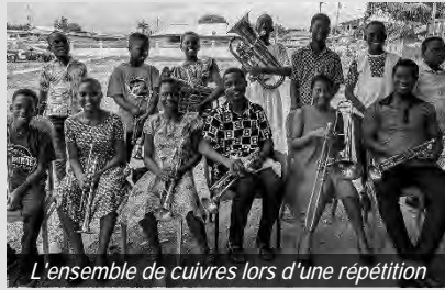
L'ensemble de cuivres lors d'une répétition

En utilisant les talents disponibles, non seulement Dieu est glorifié, mais la communauté est également élevée et son avenir est également façonné par la musique.