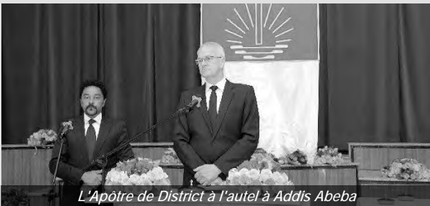
L'Apôtre de District à l'autel à Addis Abeba