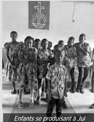
Enfants se produisant à Jui