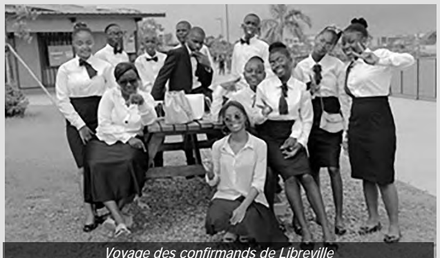
Voyage des confirmands de Libreville

Jésus Christ est la vérité, il nous aime et il aime aussi notre prochain. Nous sommes tous invités à suivre notre Seigneur Jésus en pratiquant la foi aussi par nos œuvres ainsi qu'en nous soutenant les uns les autres sur le chemin qui mène à la communion éternelle avec Dieu.