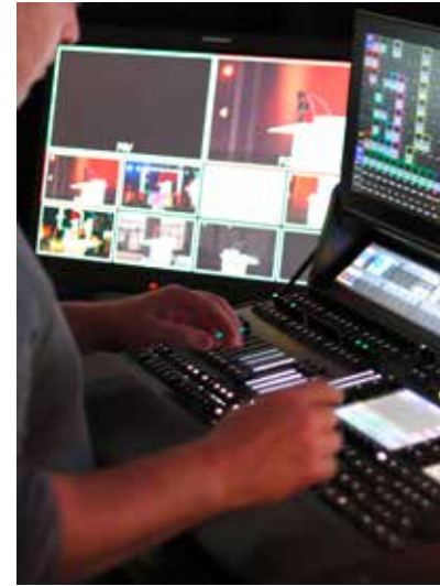
In der Gartenhalle werden Kisten ausgepackt und Plakate aufgehängt. Auf dem Festplatz braucht es auch viele Helfer. Und die Technik will auch gut vorbereitet sein.

Donnerstag, 9. Mai 2024, Christi Himmelfahrt: Nachdem im Laufe der Woche schon viele Helfer angereist sind, kommen am Donnerstag Vormittag zahlreiche weitere in Karlsruhe an. Es gibt noch viel zu tun in den Hallen des