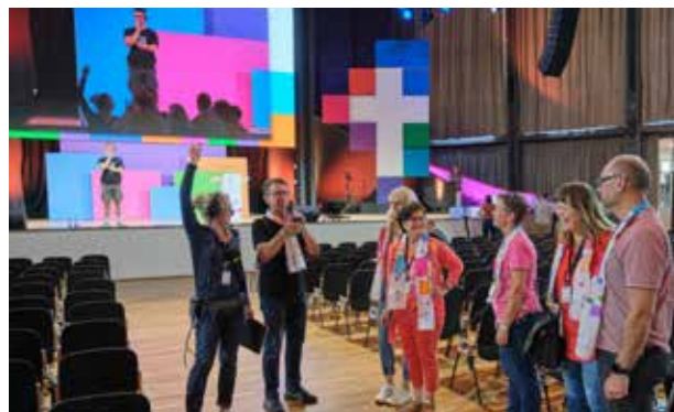
Am Donnerstagnachmittag findet in der Schwarzwaldhalle die Generalprobe für die Eröffnungsfest am nächsten Tag statt.