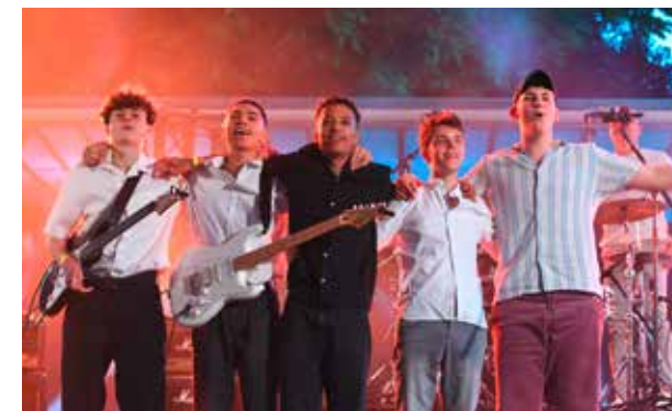
Den Anfang machen die fünf Band-Mitglieder von „The Beat Boyz“ aus Karlsruhe – ein Heimspiel für die langjährigen Freunde.