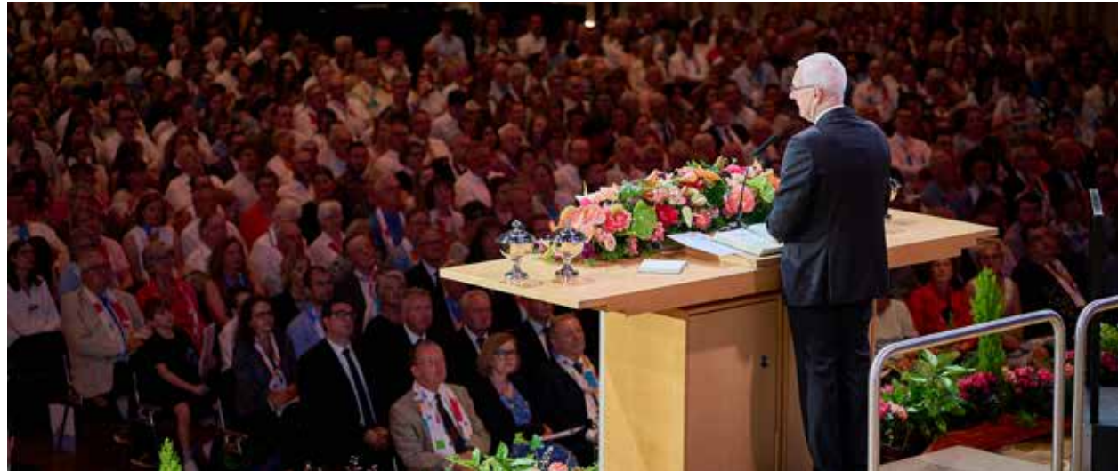
In der Schwarzwaldhalle feiern rund 3600 Gläubige den Festgottesdienst mit unserem Bezirksapostel und den süddeutschen Aposteln und Bischöfen.