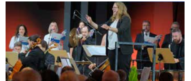
Ein vokales Doppelquartett und ein Orchester erfreuen die Zuhörer mit ihrem gekannten Musizieren.

Nach Dankesworten des Bezirksapostels an Gott – auch für das schöne Wetter –, an den Bürgermeister und die Einwohner von Karlsruhe, die Vertreter der Ökumene und die vielen ehrenamtlichen Helfer endete der Gottesdienst mit dem gemeinsam gesungenen Lied „Kommet her!“, das eigens für den Kirchentag komponiert wurde. Damit schloss sich der Kreis vom Motto des Kirchentages hin zum Bibelwort und Schlusslied des Gottesdienstes.