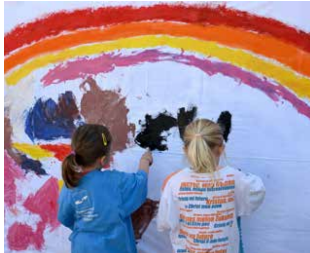
An verschiedenen Stellen wird unter dem Motto „Malen, Basteln, Spielen“ ein buntes Programm für die kleinsten Besucher geboten.

Samstag, 11. Mai 2024: Wie bereits der Freitag, so beginnt auch der Samstag für die Kirchentagsteilnehmer mit strahlendem Sonnenschein. Dass sich das Wetter an diesem Wochenende von der schönsten Seite zeigt, lässt die