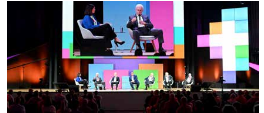
In einem Podiumsgespräch wird diskutiert, welche Rollen Kirche und Wirtschaft in der Gesellschaft haben und wie unterschiedliche Ziele zusammenwirken können.