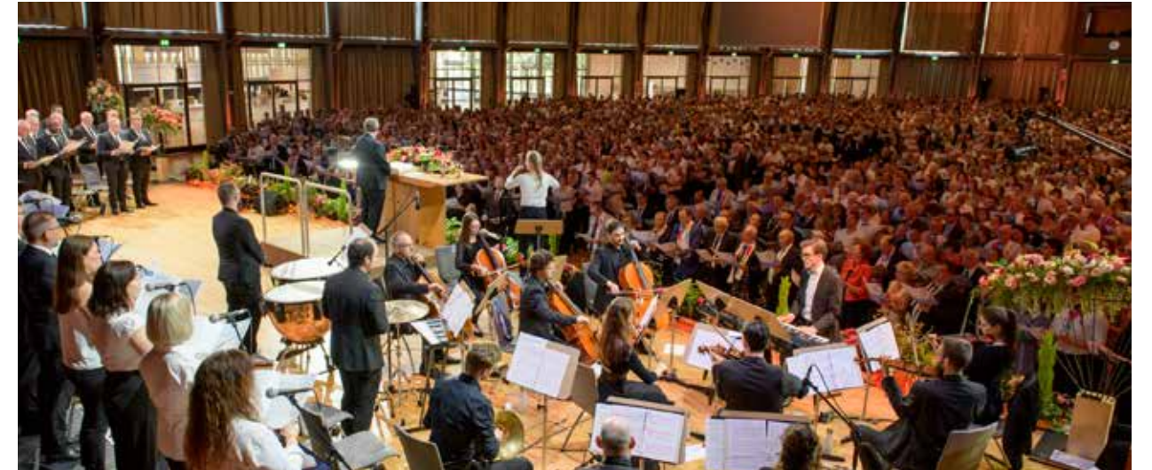
Ein großer Chor aus allen Kirchentagsteilnehmern in der Schwarzwaldhalle sorgt für freudige und festliche Stimmung.