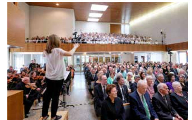
Chor und Orchester erfreuten die Zuhörer.

Der Stammapostel führte hierzu aus, dass Jesus einen Auferstehungsleib hatte, der kein irdischer Leib mehr war, sondern etwas Heiliges, etwas Vollkommenes. „Und das bedeutet natürlich auch für uns: Bei der Auferstehung werden wir verwandelt. Wir bekommen einen neuen Leib, einen vollkommenen Leib. Aber die Herzenseinstellung, die muss jetzt schon stimmen. Jetzt schon sollen wir die Einstellung Jesu Christi haben.“