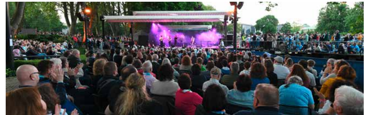
Nach dem Gottesdienst folgen zwei stimmungsvolle Abendkonzerte an der Seebühne im Zoologischen Garten vor mehr als 1000 Besuchern.

noch nicht kennt, folgt einfach unauffällig den vielen Menschen mit Kirchentagsschal. Beim Eingangslied dann die große Überraschung: der Stammapostel ist gekommen! Die Freude ist den vielen Helfern deutlich anzusehen.