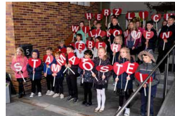
Die Kinder begrüßten den Stammapostel und den Bezirksapostel herzlich.