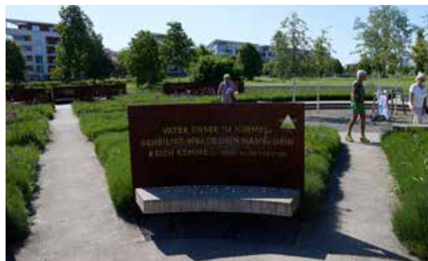
Die SKT-Besucher haben großes Interesse an den Führungen durch den Garten der Religionen sowie durch die Stadt Karlsruhe.