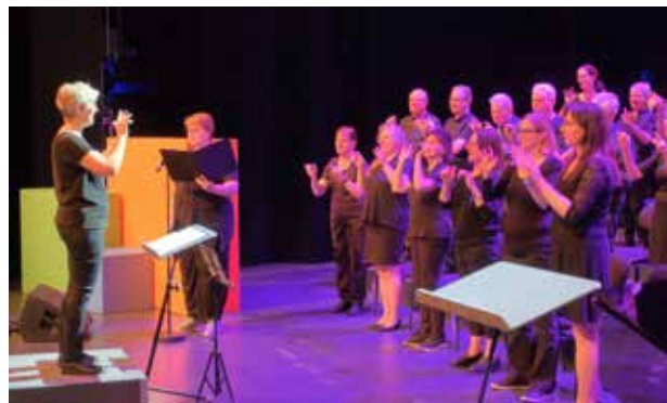
Musik sichtbar machen – ein inklusives Konzert mit Gebärdenpoesie verbindet die Welt des Hörens mit der Welt des Sehens.

Programmverantwortlichen erleichtert aufatmen, denn einige Veranstaltungen und Angebote sind nur ein gutem Wetter möglich. Viele Familien nutzen den freien Eintritt in den Zoologischen Garten, um die Tiere zu bestaunen.