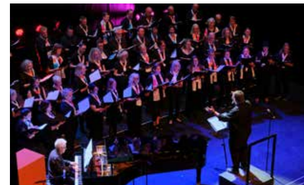
Das Konzert des Projektchors der Kirchenbezirke Esslingen/Stuttgart-Degerloch und Nürtingen steht unter dem Motto „Wings – Flügel“.