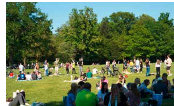
Im Karlsruher Schlossgarten trifft sich am Nachmittag die Jugend zum Kontakten knüpfen und Chillen.

sein. Das Programm auf dem ganzen Gelände bietet immer wieder Alternativen. Die Vielfalt eröffnet die Möglichkeit, den Glauben zu vertiefen, neue Perspektiven zu gewinnen, Kontakte zu knüpfen und die Gemeinschaft zu stärken.