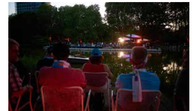
Diese Kirchentagsbesucher lassen den Samstagabend entspannt mit Blick auf das Konzert an der Seebühne ausklingen.