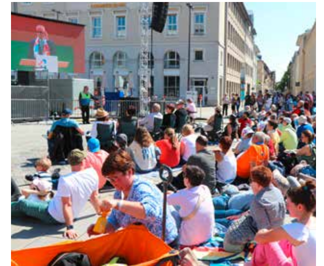
Die Eröffnungsfeier wird auch auf den Marktplatz übertragen.

Direkt im Anschluss an die Eröffnungsfeier beginnt das umfangreiche Kirchentagsprogramm. Um die Mittagszeit gehen viele Teilnehmer aber erst einmal auf den Festplatz. Dort gibt es beim Wiedersehen mit Freunden oft ein großes