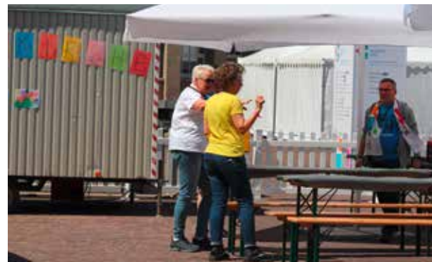
Auf dem Festplatz bereiten Helfer einen Kinderbereich mit verschiedenen Spiel- und Bastelmöglichkeiten vor.