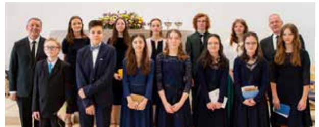
Zwölf strahlende Konfirmanden in der Gemeinde Heidelberg-Werderstraße

Der Predigt in den Gottesdiensten, in denen Konfirmation gefeiert wurde, lag ein Bibelwort aus dem Johannes-evangelium zugrunde: „Ich bin der Weg und die Wahrheit und das Leben.“ (aus Joh 14,6). Mit diesem Bibelwort rich-