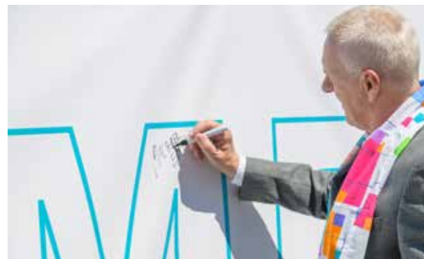
Der Bezirksapostel eröffnet bei strahlendem Sonnenschein auf dem Festplatz die rund 90 Meter lange „Wand der Begegnungen“.