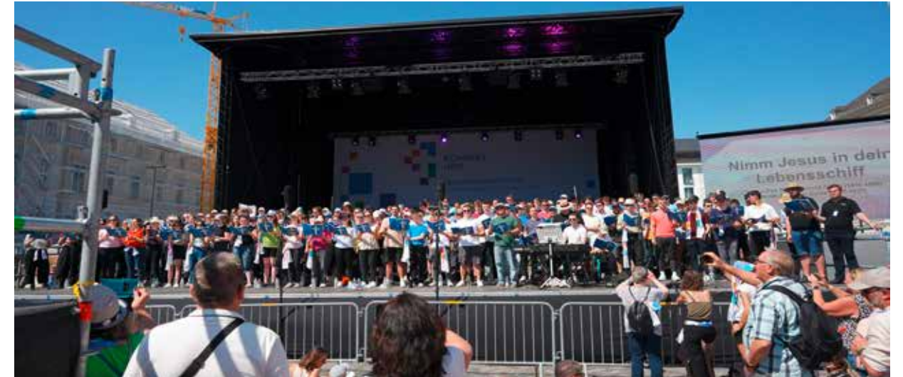
Der Süddeutsche Jugendtag trifft den Süddeutschen Kirchentag: Der Jugendchor von 2023 gibt auf dem Marktplatz ein begeisterndes Konzert.

Einige Programmpunkte ziehen die Teilnehmer besonders an, und so muss man mancherorts vor den Veranstaltungsräumen anstehen. Wer leider keinen Platz mehr zum gewünschten Angebot bekommt, muss nicht lange enttäuscht