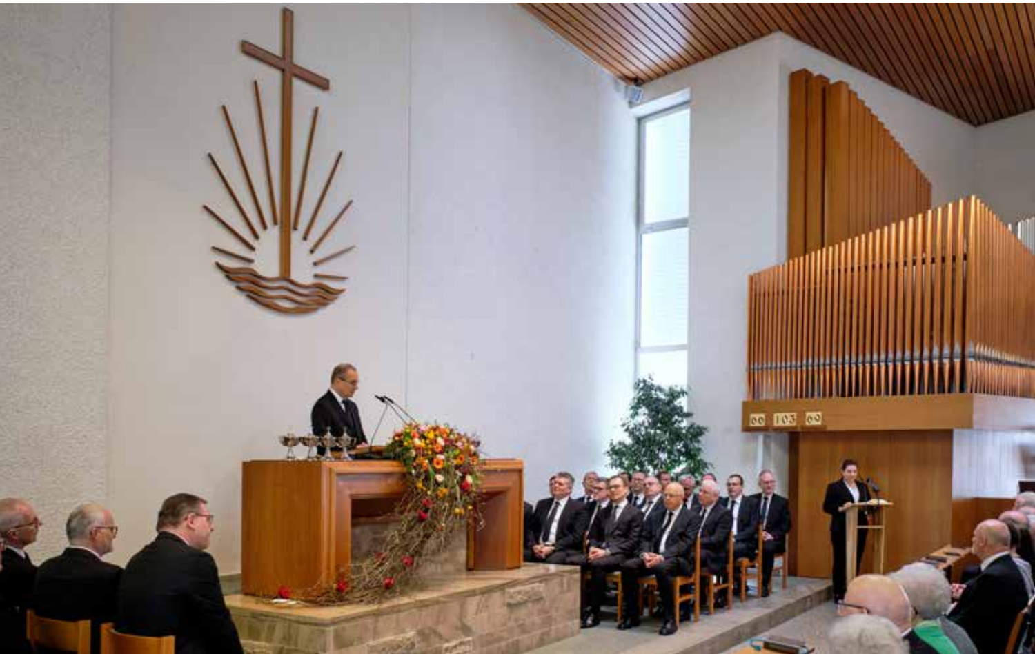
Zu Beginn des Gottesdienstes laschten der Stammapostel und alle Gläubigen einer Bibellesung.