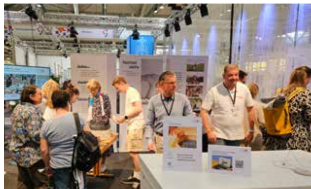
In der Gartenhalle herrscht reges Interesse an den unterschiedlichen Informationsständen der Gebietskirche.