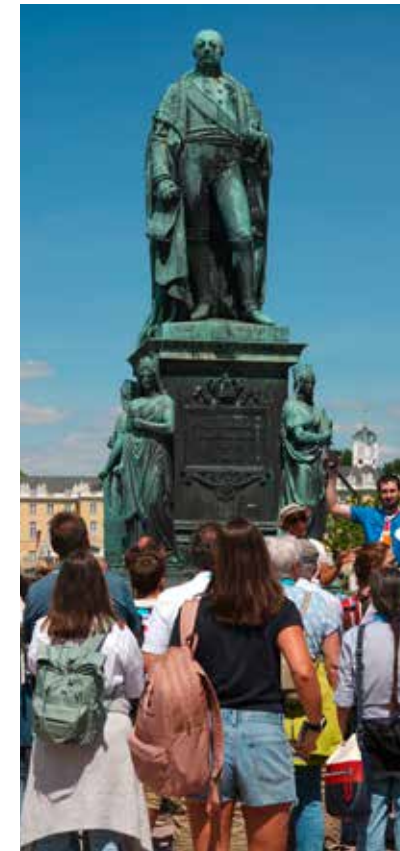
Im Rahmen einer einstündigen Führung kann die Fächerstadt Karlsruhe entdeckt werden.

Hallo. Auf Bierbänken sitzend lässt man sich das Essen schmecken, das vergünstigt an Ständen erworben werden kann. Frisch gestärkt werden dann Pläne geschmiedet, welche Veranstaltung als nächste besucht wird.