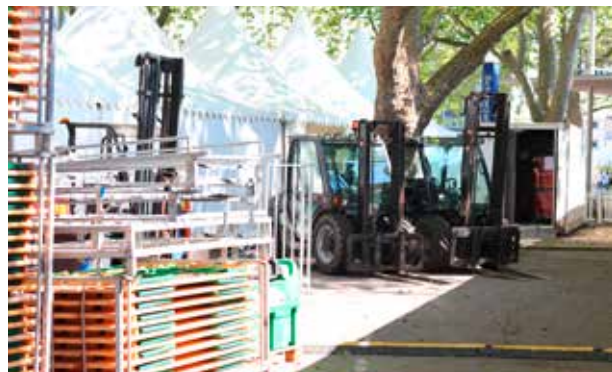
Für den Aufbau von weit mehr als 1000 Sitzplätzen an Biertischen und -bänken braucht es schweres Gerät.

Kongresszentrums und auf dem Festplatz. In der Gartenhalle stellen die Helfer die Informationsstände fertig. In der Schwarzwaldhalle wird das technische Equipment aufgebaut, und schon steht auch die erste Generalprobe an.