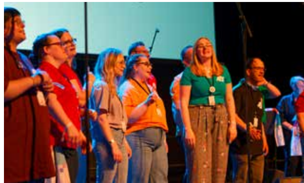
Faktor G ist eine Gruppe von Jugendlichen mit und ohne Behinderung aus Westdeutschland. Bei ihrem Auftritt vereint sie die Freude an der Musik.

beim SKT, abwechselnd in Kurzfilmen und real auf der Bühne dargestellt. Danach begrüßt der Bezirksapostel alle Teilnehmer und heißt sie willkommen. Abschließend folgen Reden von Gästen aus Politik und Ökumene.