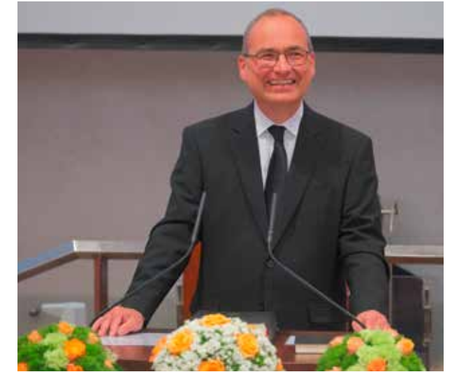
Die Kirche in Karlsruhe-Mitte ist am Abend so gut wie belegt. Der überraschende Besuch des Stammapostels ist für die vielen Aufbauhelfer eine schöne Belohnung.

Kaum sind am späten Donnerstagnachmittag die letzten Vorbereitungen für den Kirchentag erledigt, wird es auch schon Zeit für den Abendgottesdienst. Wer den genauen Weg vom Kongresszentrum zur Kirche in Karlsruhe-Mitte