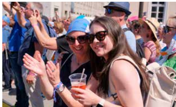
Auf dem Marktplatz herrscht bei verschiedenen Konzertauftritten tolle Stimmung. Der Kirchentagsschal wird zum Sonnenhut.