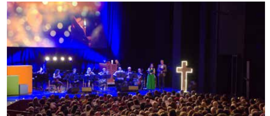
Eine musikalische Abendandacht gibt es im Konzerthaus. Unter dem Motto „Jesus, ich komme zu dir“ wird miteinander gesungen und Gottes Nähe gesucht. So kann der Tag in besonderer Weise ausklingen.