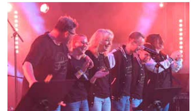
Die Jugendband „Gold“ aus Pforzheim spielt zum Abschluss des Tages ihr Programm „Gold in Concert“.