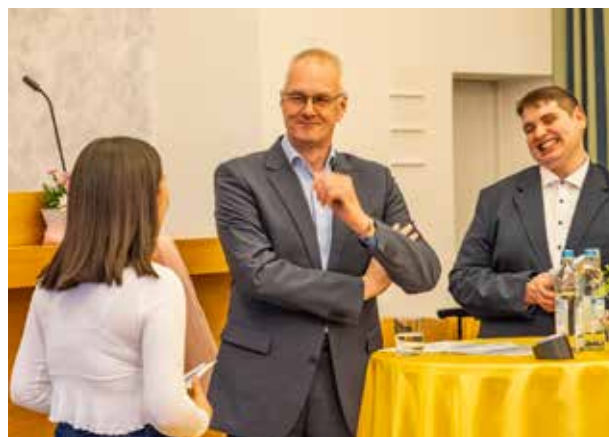
Der Bezirksapostel beantwortete gerne die Fragen der Jugendlichen.

Fragen an den Bezirksapostel waren zum Beispiel, wo er denn auf seinen Reisen übernachtet, welcher Gegenstand ihm dabei am wichtigsten ist und welche Gefahren es in den betreuten Gebieten gibt, besonders in Regionen, wo Christen verfolgt werden.