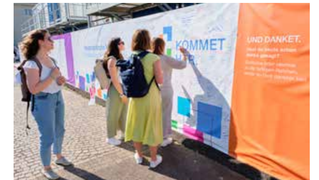
Am Samstag wird der freie Platz auf der Wand der Begegnungen bereits knapp – jedes Stückchen weiß wird ausgenutzt.