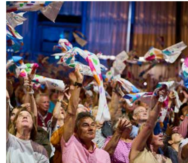
Stimmung! Und die SKT-Schals fliegen in der Schwarzwaldhalle in die Höhe!