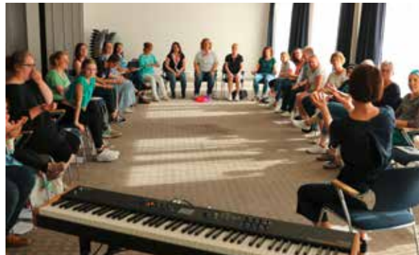
Das Interesse der Kirchentagsteilnehmer an den verschiedenen Workshops ist sehr groß. „Singen mit Kindern“ gibt frische Ideen und Impulse.