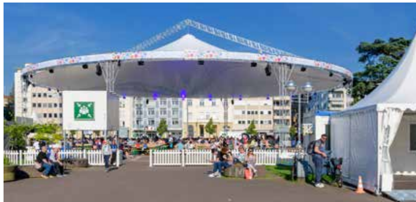
An den Cateringständen gibt es eine tolle Auswahl an Essen – und Schatten unter dem großen Pavillon.