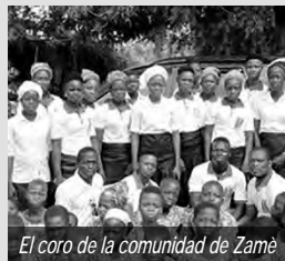
El coro de la comunidad de Zamè