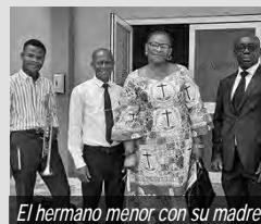
El hermano menor con su madre

La comunidad de Osu había fundado una orquesta e invertido en varios instrumentos para involucrar a los niños y jóvenes en la vida activa de la comunidad. Se habían llevado todos los instrumentos excepto una trompeta. El rector oró fervientemente por un trompetista. Sin que él lo supiera, a un talentoso trompetista de la República Democrática del Congo se le había negado una solicitud para viajar con un trompetista de su comunidad. Quería ofrecer su talento y servir a cualquier comunidad que encontrara en Accra. Rezó