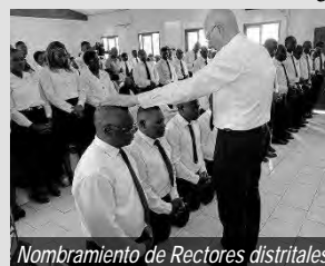
Nombramiento de Rectores distritales

Desde Libreville el apóstol de distrito voló primero a Port-Gentil, la segunda ciudad más grande de Gabón. Allí celebró un Servicio Divino durante el cual nombró a un rector de distrito y a un vicerrector de distrito. Después del Servicio Divino el apóstol de distrito regresó a la capital. A continuación, tuvo lugar el Servicio Divino dominical en nuestra iglesia de Libreville.