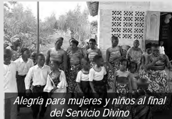
Alegría para mujeres y niños al final del Servicio Divino

El 12 de mayo de 2024, durante la jornada de la mujer en la comunidad de Adja-Gbongodo, el apóstol explicó cómo funciona la oración. Es eficaz para nosotros y para nuestros vecinos. Cuando intercedemos por otros ante el Señor, Él está mirando la disposición de nuestro corazón y nuestra fe.