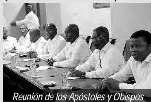
Reunión de los Apóstoles y Obispos