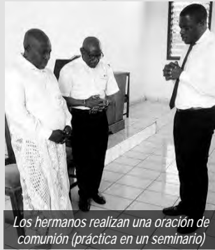
Los hermanos realizan una oración de comunión (práctica en un seminario)