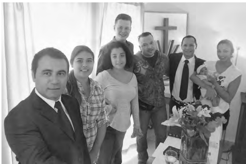
La comunidad en la sala de estar en Querétaro