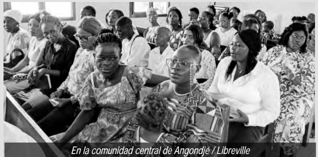
En la comunidad central de Angondjé / Libreville