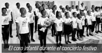
El coro infantil durante el concierto festivo

El Apóstol de distrito predicó basándose en el texto bíblico Mateo 28,20: "Y he aquí, yo estaré con vosotros todos los días, hasta el fin del mundo."