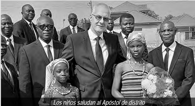
Los niños saludan al Apóstol de distrito