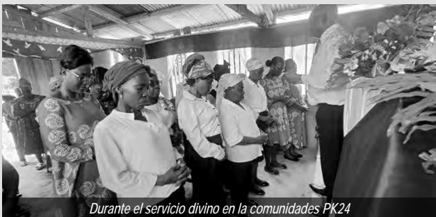
Durante el servicio divino en la comunidades PK24