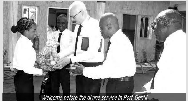
Welcome before the divine service in Port-Gentil

2024. El Apóstol de distrito sirvió en el Servicio Divino con el texto bíblico de Juan 14:1: "No se turbe vuestro corazón. Cree en Dios y cree en mí." Se jubilaron tres rectores de distrito y se nombraron tres nuevos y se designaron cuatro vicerrectores de distrito.