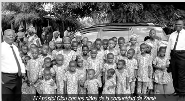
El Apóstol Olou con los niños de la comunidad de Zamè