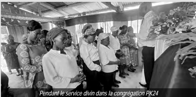
Pendant le service divin dans la congrégation PK24