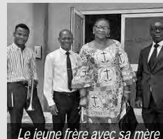
Le jeune frère avec sa mère

La communauté d'Osu avait commencé un orchestre et investi dans un certain nombre d'instruments pour engager les enfants et les jeunes dans la vie active de la communauté. Tous les instruments avaient été pris à l'exception d'une trompette. Le recteur a prié avec ferveur pour un trompettiste. A son insu, un trompettiste talentueux de la RDC s'était vu refuser une demande de voyager avec une trompette de sa communauté. Il voulait offrir son talent et servir toute communauté qu'il trouverait à Accra. Il a prié pour que Dieu trouve un moyen pour