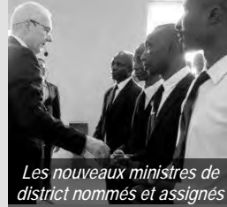
Les nouveaux ministres de district nommés et assignés