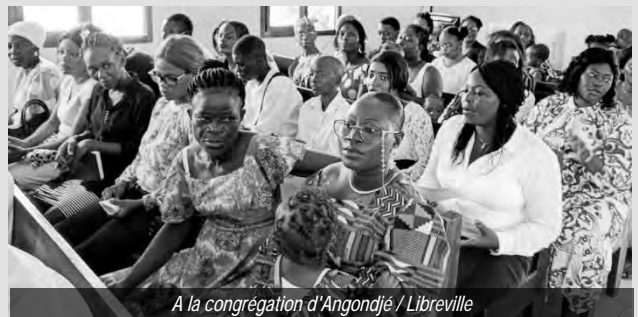
A la congrégation d'Angondjé / Libreville