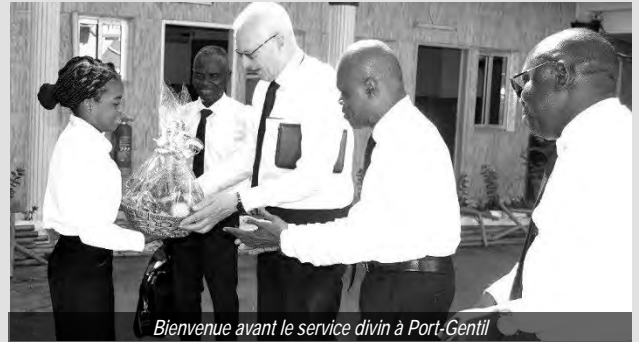
Bienvenue avant le service divin à Port-Gentil