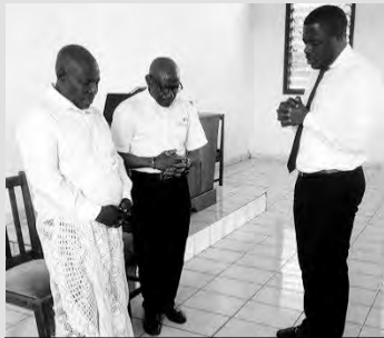
Les frères prient en communion lors d'une visite d'assistance spirituelle (pratique en séminaire)