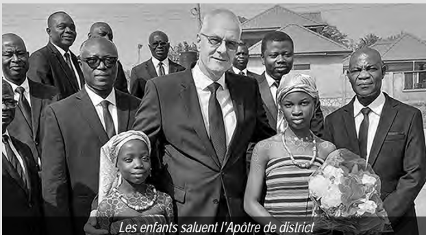
Les enfants saluent l'Apôtre de district