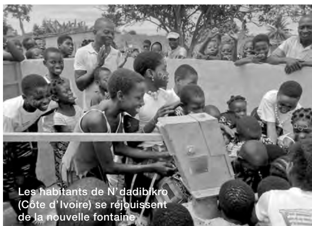
Les habitants de N'dadibikro (Côte d'Ivoire) se réjouissent de la nouvelle fontaine