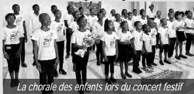
La chorale des enfants lors du concert festif

L'Apôtre de district a prêché sur le texte biblique de Matthieu 28 : 20 : « Et voici que je suis avec vous tous les jours, jusqu'à la fin du monde. »