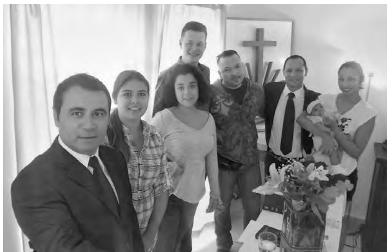
La communauté de salon à Querétaro