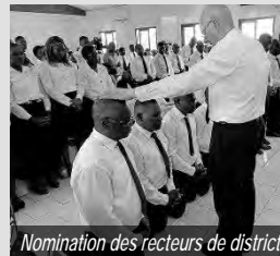
Nomination des recteurs de district