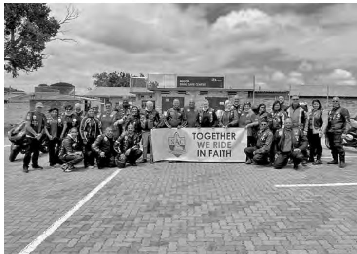
Des motos et des animaux en peluche – ce qui semble ne pas être compatible est une tradition au sein de l'Église territoriale d'Afrique australe