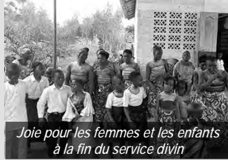
Joie pour les femmes et les enfants à la fin du service divin