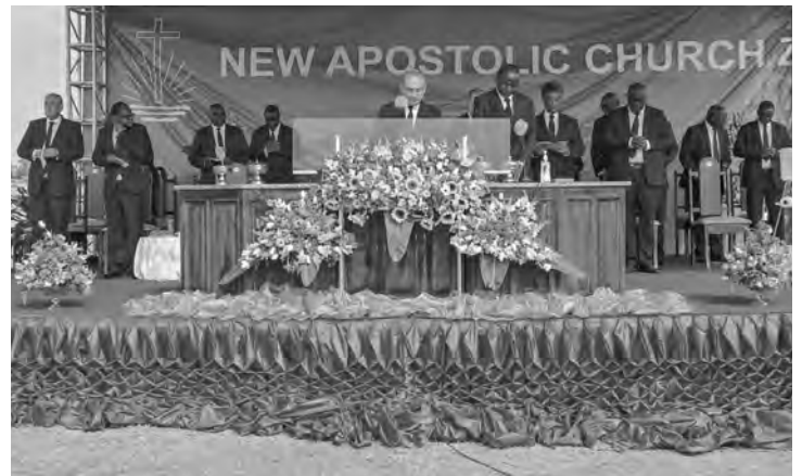
L'apôtre-patriarche Jean-Luc Schneider a célébré le service divin à Namwala (Zambie) avec une grande assemblée en plein air